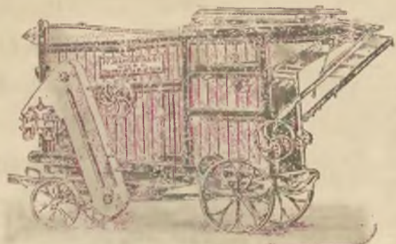
Uznane za najcelniejsze