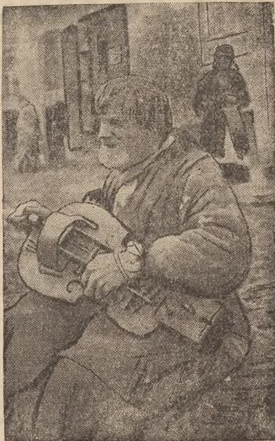
Zdjęcie nasze przedstawia oryginalny typ „lirnika wołyńskiego”. Tacy lirnicy należą już obecnie do rzadkości.