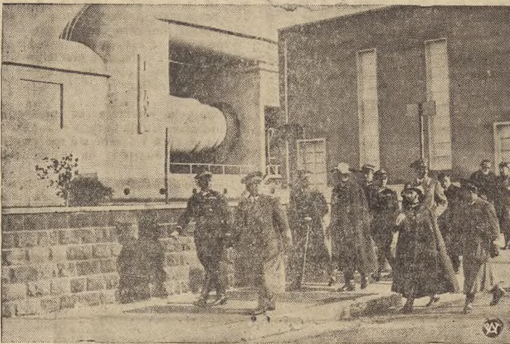
Moment zwiedzania przez polską delegację wojskowo-legionową z gen. Wieniawą Długoszowskim na czele, miasta Guidonia, zbudowanego w ostatnich latach na osuszonych błotach pontyjskich