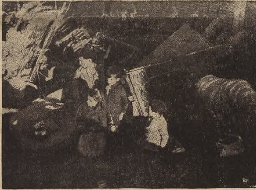
Reprodukujemy niezwykle przykry, poprostu wstrząsający obrazek z życia codziennego dzisiejszego Madrytu, pustoszonego wszelkimi narzędziami wojny. Na zdjęciu widzimy zniszczone bombami wnętrza domu, a w nim grupę biednych, ościroconych dzieci hiszpańskich, podczas Świąt Bożego Narodzenia.

Na razie sytuacja pozostaje bez zmian. Zaopatrzenie Paryża jest zapewnione w skali prawie normalnej dzięki inicjatywie prywatnej i pomocy samochodów wojskowych.