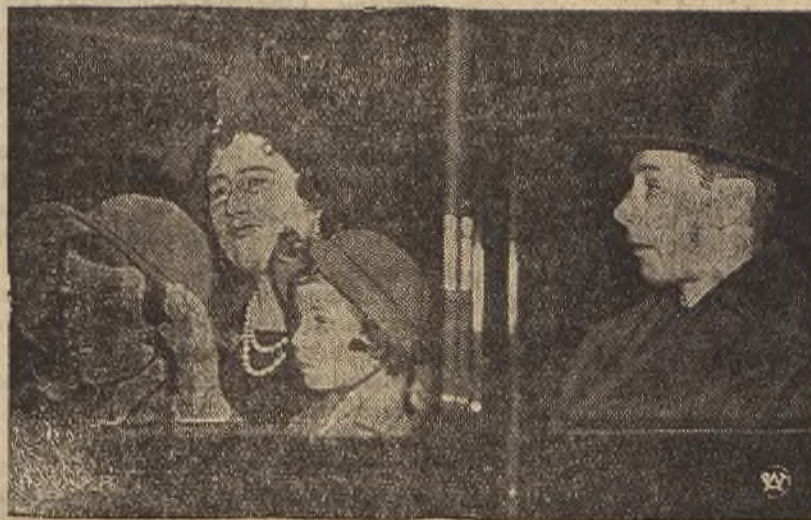
Król Anglii Jerzy VI-y w towarzystwie królowej Elżbiety i córek: ks. Elżbiety i Małgorzaty Róży opuszcza w samochodzie Londyn, udając się na święta do swej posiadłości wiejskiej w Sandringham.