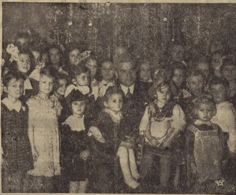
Minister Komunikacji płk. Ulrych, w otoczeniu rozbawionej dziatwy, podczas tradycyjnej choinki w Ministerstwie Komunikacji