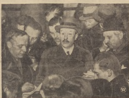
Premier francuski Chautemps opuszcza Pałac Elizejski, po zakomunikowaniu Prezydentowi Lebrun o wywiązaniu się z misji utworzenia nowego rządu. Premiera otoczyli nieszczęśliwie dziennikarze.