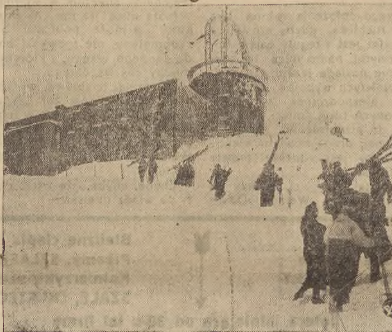
Rzut oka na budynek Obserwatorium (zbudowany z kamienia i ma 13 pomieszczeń)