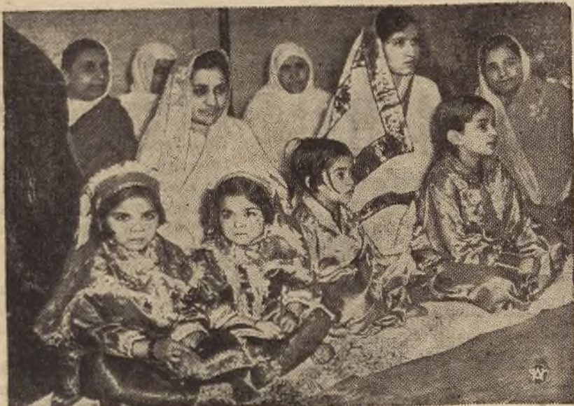
W Londynie odbyły się w tych dniach, zorganizowane przez tamtejszą kolonię wyznawców Islamu, uroczystości Święta Islamu. Na zdjęciu — grupa Indianek z dziećmi, w oryginalnych strojach, podczas Święta Islamu.