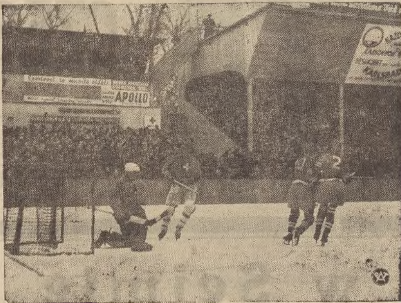
Fragment meczu hokejowego Polska-Szwajcaria, rozegranego w ramach Międzynarodowych Zawodów Hokejowych w Pradze Czeskiej.