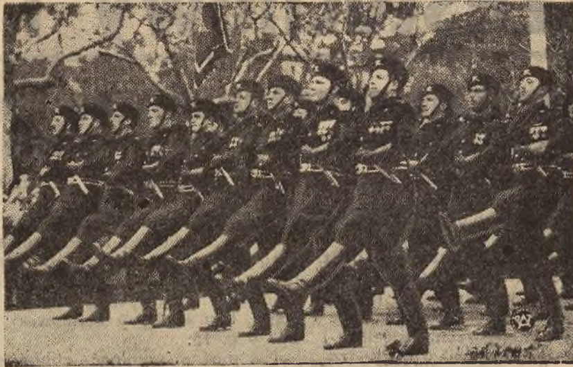
W milicji i armii faszystowskiej został wprowadzony rozkazem Mussoliniego t. zw. „krok rzymski” (Passo Romano). Na zdjęciu — oddział milicji faszystowskiej w pa- radnym marszu krokiem rzymskim.