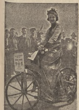
W czasie uroczystości poświęcenia pamięci Benza w Mannheimie odbył się pokaz dawnych samochodów. Na ilustracji widzimy pierwszy dwukolowy motor Mercedes z r. 1885.