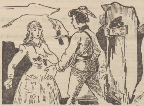
Gdy podchodziła do wyjścia z jaskini, uczienniczek zastąpił jej drogę...

znajdowała. Teraz dopiero zrozumiała, że Klimczok nie pozostawił uczniaka na to, aby ją bronił, tylko na to, aby ją pilnował. Trzeba więc było uciekać! Każdej chwili mógł Klimczok ze swoimi towarzyszami powrócić. Gdyby ucieczka nie udała się za wczasu, byłaby zgubiona! Wszystkie myśli z blaskawością szybkością przebiegły jej przez głowę. Natychmiast opanaowała się z uśmiechnęła.