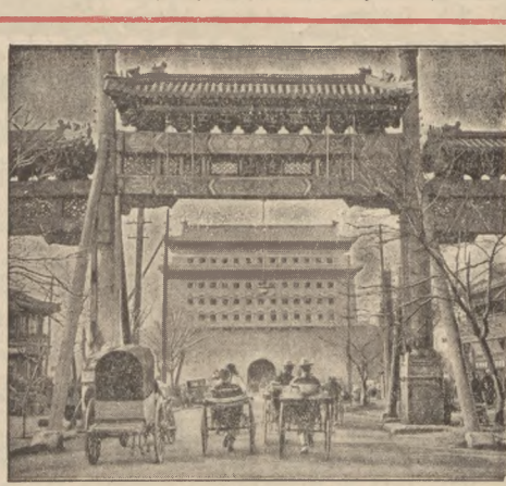
Armia japońska maszeruje na Pekin. W mieście, w oczekiwaniu ataku ogłoszono stan oblężenia, a w dzielnicy dyplomatycznej wzmożono załogi wojsk cudzoziemskich. Na ilustracji malownicza brama Chien-Men w murze zewnętrznym, który otacza miasto.

Wszystkie pisma podziwiała tej sprawie wielkie miejsca, co świadczyło o wielkiej emocjonalności niemieckiej.