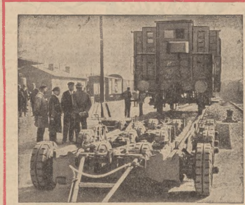
Aby uniknąć kosztów przeladunku, koleje niemieckie zastoso- wowały wagony wprost do odbiorców w mieście przy pomocy obry- zmionki podwozia. Wagon wprost z szyn zostaje wyciągnięty na podwozie spoczynujące na 16 kołach gumowych, a następnie przy pomocy trak- tora dostarczony odbiorcy.

ninach znaleziono szczątki samolotu, oraz zwłoki znanego lotnika angielskiego Hertha Hinklera, który w dniu 7 stycznia wyruszył do lotu Londyn — Australia i od tego czasu zaginął.