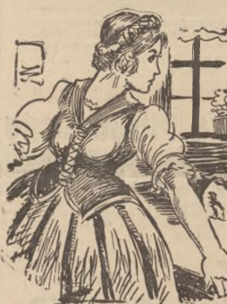
Pietrowicz odskoczył jak oparzony...

Nie mam wcale zamiaru pociągnąć cię do odpowiedzialności za pomoc, jaką udzieliłaś zbrojcy Klimeczkowi, ponieważ uczyniłaś to z miłości. Nie chcę więc mówić o tem, co się już stało, ale nie mogę zamilczeć tego, co jest obecnie. Zresztą miałas już dosyć czasu, kochane dziecko, aby się dostatecznie przekonała, że Klimeczko nie jest takim bohaterem, jakiego w nim uwielbiałaś. W szczególności małżeństwo doszłaś pewnie już do poznania.