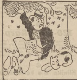
Fronck sędził w swym ogrodzie, gdyż spasy nie usiła, zrzucił kłój jest na chłodzię, tyko... rucchy dolozczyła.