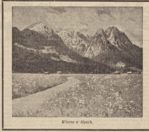
Wiosna w Alpach.

6) Porozumienie niniejsze będzie ratyfikowane w jaknajszerszym czasie i zarejestrowane w Lidze Narodów.