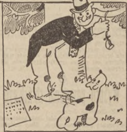
Lez radę znalazł morowa : na galezi w g'ry, tuż nad „Clapka” swego głowa wleza c kłójki kawał skóry.