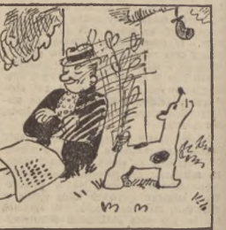
Teraz cicho i w spokoju, pod zilonem, wielkiem drzewem odpoczywa po swym znoju, kłoyarsy piastaczki wozu.