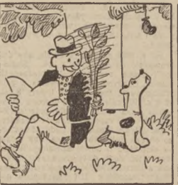
„Clapka”, nęcony przekąska, swym ogonkiem wymacuje i przy wleżaniu gązarka, pana swego wciąż wachula.