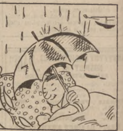
Deszczuy sobie dał kaple, lecz nasz Froncek smaczny chrapie, śniac o lepszych Śląska czasach, o ciasteczkach, o kłobasach.

Miesięczna prenumerata „7 GROSZY” wynosi zł. 2,00 W kraju z przysyłką pocztową . . . . . zł. 2,31 Przy zamówieniu w urzędzu pocztowym . . . . . zł. 2,41