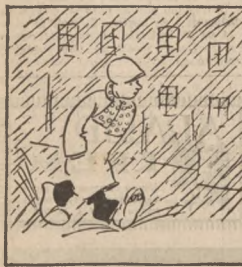
Deszcz na dworze, ciagle chlapie, więc Froncek po błocie „zapił”. cacy, biedak, przemoknięty, wygłodniały i zmarnieły.