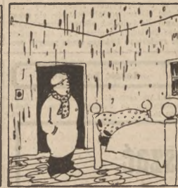
Leok nie chce się zbytnio „brucha”. łowem gźur jest pełno w drachach, więc jest trudna na rada, a gdzie i 1 złbie, deszczuy pada.