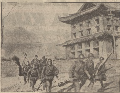
Wojna japońska w swym zwycięskim pochodzie, zajmując bogatą i żyzną prowincję Dżehol, uczynili wyłom w historycznym murze chińskim i posuwają się na Pekin. Zanim Liga Narodów zdecyduje się na energiczniejsze wystąpienie — Japończycy zajmą Pekin, ake północne Chiny i osadzą na tronie b. cesarza Pu-Yi, obecnego prezydenta państwa mandżurskiego Mandżukuo.

Dla orientacji, podajemy taki horoskop dla wszystkich urodzonych 21-go stycznia do 18-go