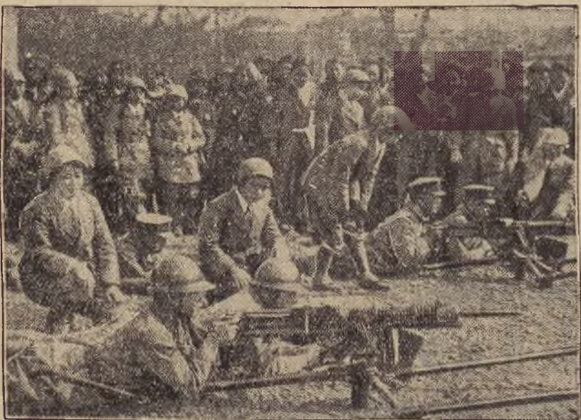
Militaryzm staje się w Japonii bardzo popularny. Przy stałej armii powstają specjalne bataliony kobiece, szkolone na sposób kadr męskich.