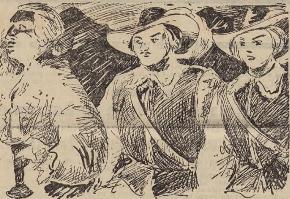
Weszli za swoim przewodnikiem na schody...

— Pójdę do Bastylji... a to gorsze, niż śmierć! — przyznał Wiktor.