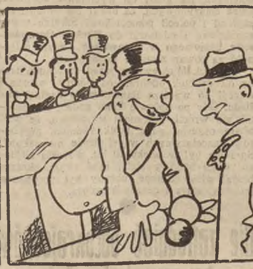
Gra polega bowiem na tem, że przy pomocy tych piłek trzeba porzucić cylindry i zbić manekinom... gęby.