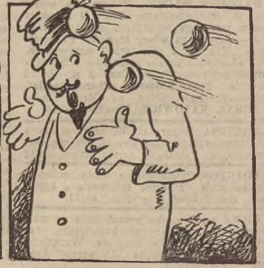
Lecz, że pan właściciel budy, też cylinder miał na głowie, przeto Froncek w niego ciska twardych piłek całe mrowie.