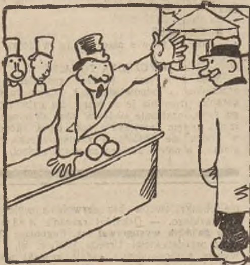
Froncka, gdy był w lunaparku, zaprasza do kiosku swego jegomość z manekinami, chcąc zarobić ze złotego.