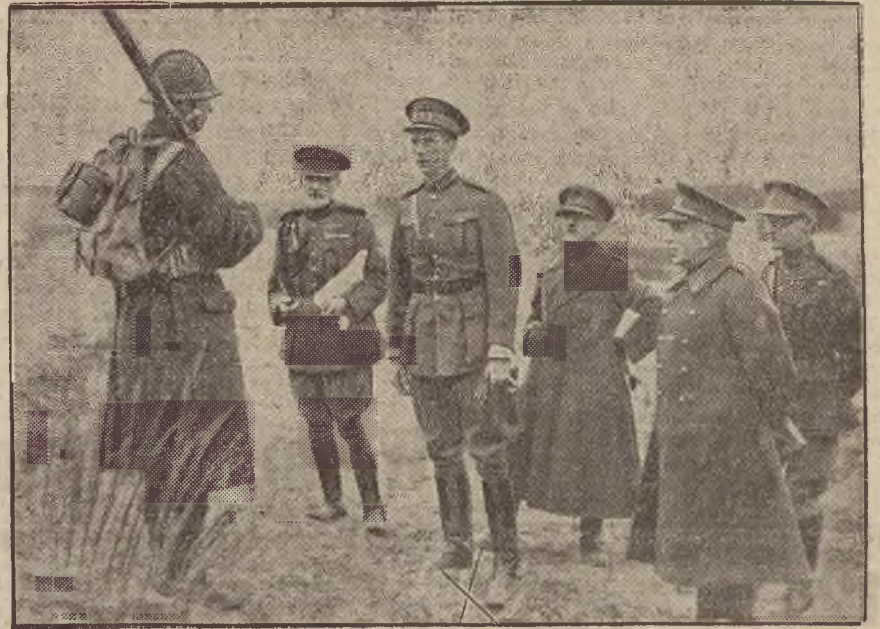
Następca tronu belgijskiego na manewrach jesiennych wojsk belgijskich.

Świadek Dynia, gajowy, stwierdza, że w nocy z 16 na 17 czerwca skradziono w lesie trzy sęgi drzewa i 2 kloce. Następny świadek Leon Jasyk, posterunkowy policji w Jasionce opisuje przebieg zajścia na terenie Zagrody Pasierba z Łukawicy. Pasierba wspomagany przez grupę ludzi, uzbrojonych w kije i kłonicę, uniemożliwił policji przeprowadzenie dochodzeń. Rozprawa trwa.