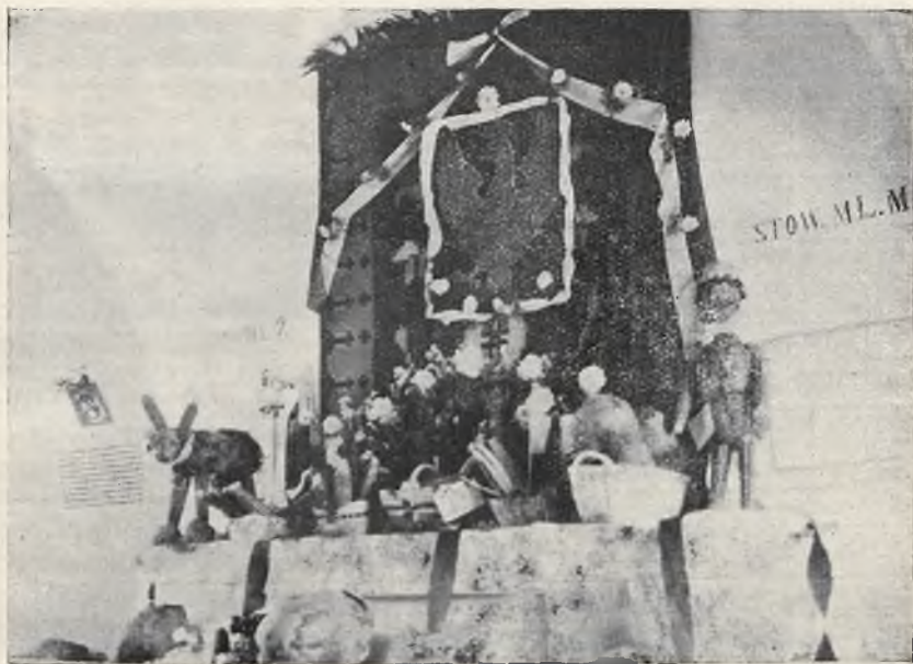
WYSTAWA p. r. W LISZKACH.

Pierwszą wystawę urządził Związek krakowski w roku bieżącym w Sułkowicach dla powiatu myślenickiego w dniu 27 października br. Udział wzięły w niej zespoły konkursowe tylko Stowarzyszeń Młodzieży Polskiej, a w szczególności następujące Stowarzyszenia żeńskie przywoziły swe eksponaty: Sułkowice, Jasienica, Rudnik, Jawornik i Krzyszkowice, nie licząc Stowarzyszeń męskich. Uczestniczki nasze przywoziły na wystawę najpiękniejsze, imponujące rzeczywiście okazy plonów konkursowych. Na urządzone z okazji wystawy zebranie przybyli przedstawiciele Okr. Towarzystwa Rolniczego z Myślenic, Małopolskiego Towarzystwa Rolniczego