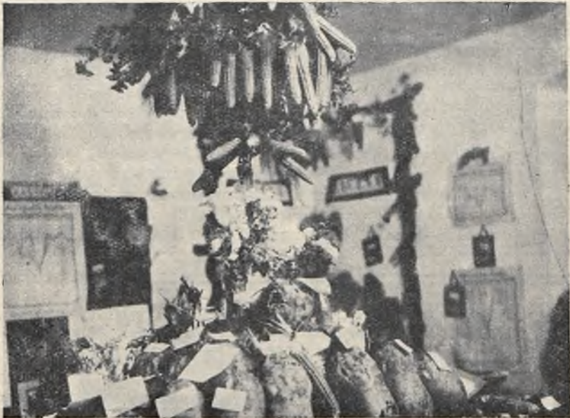
WYSTAWA p. r. W LISZKACH.