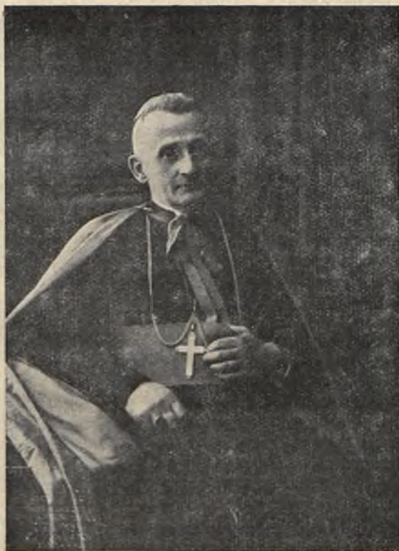
J. E. KSIĄŻĘ METROPOLITA ADAM SAPIĘHA.

TREŚĆ: Konkursy p. r. na rok 1930. — Wystawa konkursowa p. r. w Sulkowicach. — Wystawa konkursowa w Liszkach. — Wystawa p. r. w Wadowicach. — Zamknięcie konkursów p. r. w Związku za rok 1929. — Z poezji konkursowej. — Z naszych wydawnictw — W hołdzie dla J. E. Księcia Metropolity Krak. Adama Sapięhy. — Z Życia Stowarzyszeń — Ogłoszenia Sekretariatu.