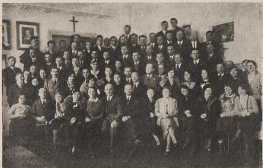
Sluchacze Związkowego Wyższego Kursu Nauczycielskiego w Wilnie.