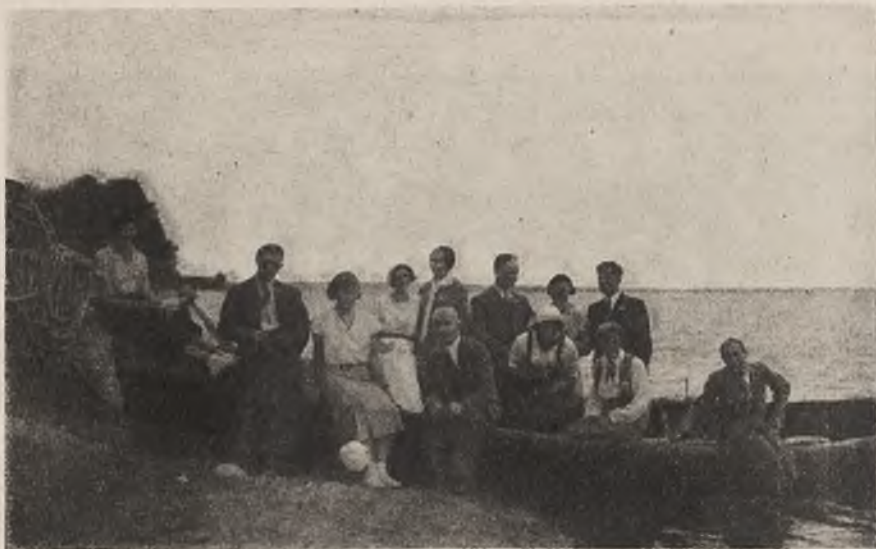
Grupa uczestników miesięcznego, wakacyjnego Wyższego Kursu Nauczycielskiego na wycieczce nad Naroczą.

Wśród form pracy samokształceniowej wybija się w ostatnich czasach Związkowy Wyższy Kurs Nauczycielski o korespondencyjnym charakterze pracy. Pierwotnie organizowany przez Wydział Pedagogiczny, w okresie sprawozdawczym przejęty został przez poszczególne komisje Pedagogiczne przy okręgach. Spotykamy też pocie-