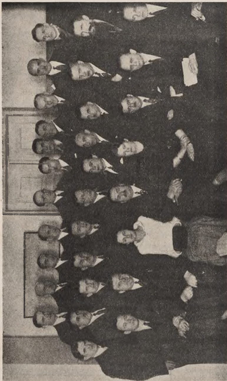
Pełny Zarząd Okręgu Wileńskiego Związku Nauczycielstwa Polskiego.