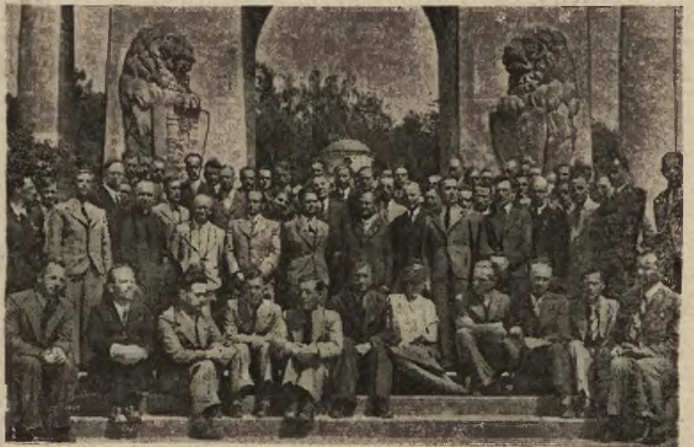
Uczestnicy kursu złożyli hołd „Orlątom Lwowskim“.

Nowością, którą należy szczególnie podkreślić jest zamiar powołania do dyrygowania niektórymi koncertami młodych kapelmistrzów polskich. Dzięki tej decyzji Polskiego Radia młodzi kapelmistrzowie będą mieli możliwość dyrygowania jednym z najlepszych polskich zespołów orkiestrowych, jakim jest Orkiestra Symfoniczna Polskiego Radia, co nie może pozostać bez wpływu na dalszy rozwój ich talentu.