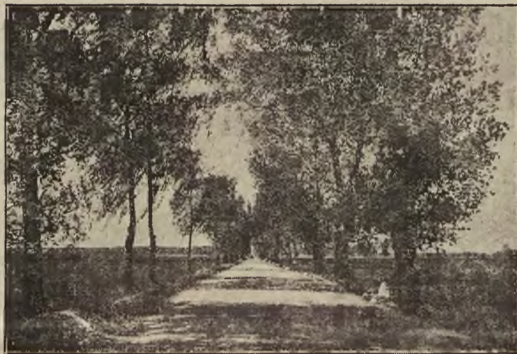
Trakt Napoleński pod Krzesławem, pow. Łaski.

O, szanujcie dziatki drzewa sadzone przez naszych rodziców, bo kto nie uszanuje drzewka, ten nie uszanuje i domu rodzinnego i roli ojczystej. A kto z lekkim sercem porządnie się ojcowizny, tego i Ojczyzna wcale nie obchodzić nie będzie, od czego broń nas Boże!