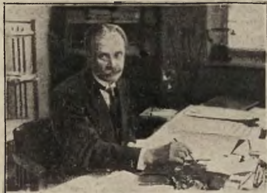
Minister rolnictwa p. Niezabyłowski.

Zjazd, na który przybyło około 50 przedstawicieli inspektoratów pracy z całej Rzeczypospolitej, potrwa do 1 listopada.