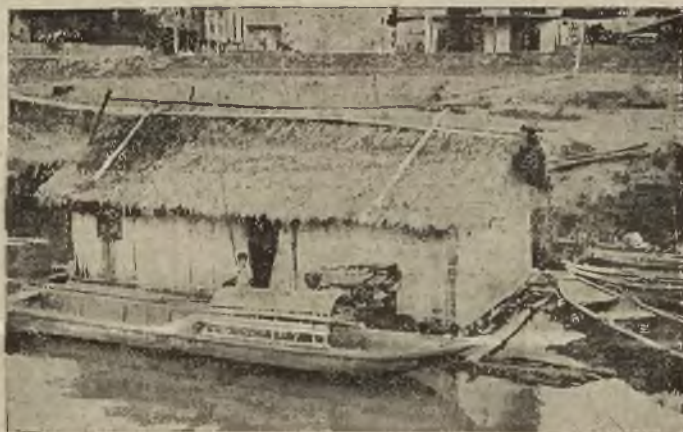
Kabotaż w Peru, łódź wyciosana z jednego pnia drzewnego.

Wynalazek ten zainteresował w znacznym stopniu uczonych całego świata, którzy przyświadczenia zgodnie, że przyrząd ten, bardzo prostej budowy, może pełnić na nowe tory psychologię doświadczalną, i rozjaśnić choć w części mroki, zasnuwające niedostępne dotychczas dziedziny ducha ludzkiego.