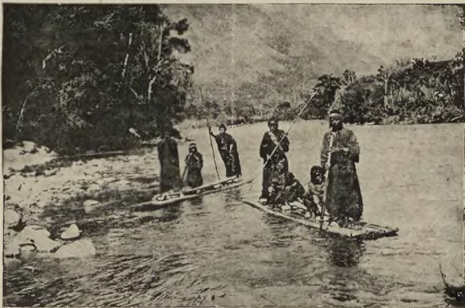
Z AMERYKI POŁUDNIOWEJ: tratwy specjalne, używane zamiast łodzi na rzece Peru.

na, przyczem większe szanse na utrzymanie siedziby tej izby zdaje się mieć Grudziądz. Czy do tej nowej pomorskiej izby przemysłowo-handlowej będzie przyłączona cała izba bydgoska, czy też niektóre jej okręgi, będzie to rozstrzygnięte w najbliższej przyszłości.