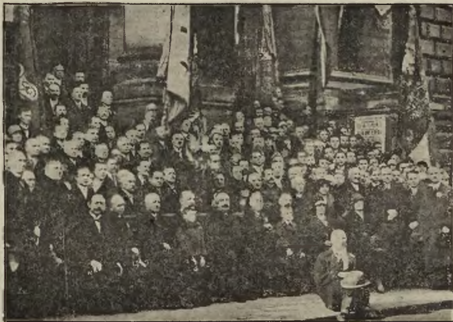
Uczestnicy jubileuszu drukarzy, zgromadzeni przed gmachem Zachęty.

Ogólne Zebranie Związku Zawodowego Introligatorów i Pokrewnych Zawodów odbędzie się d. 6 listopada o godz. 10-ej rano w lokalu Tow. Pracy przy ul. Elektoralnej 45.