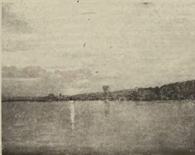
Marjampol nad Dniestrem. Zachód słońca.

Uroczystość zakończyło złożenie hołdu i czci dla poświęcenia polskiego żołnierza przez wielotyśne tłumy ludności stolicy, które w niemoim skupieniu przedefilowały przed grobem Wielkiego obywatela, który w obronie Niepodległości Ojczyzny złożył swe życie.