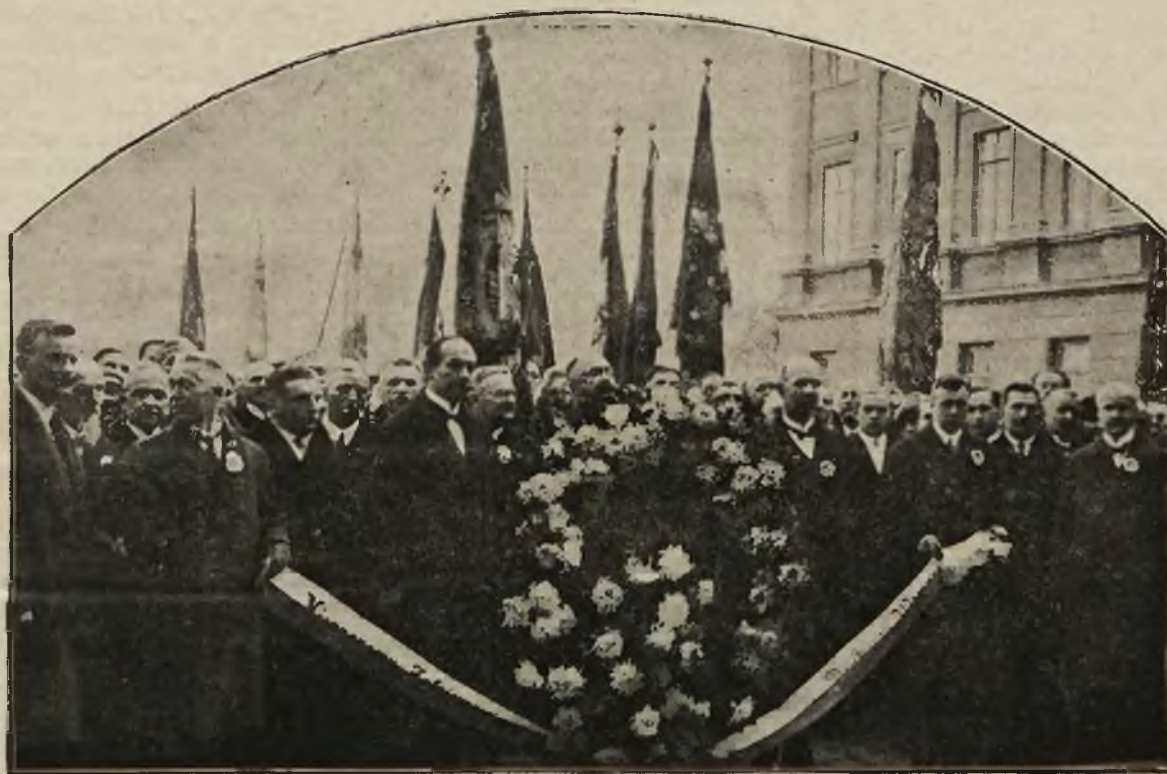
Dnia 30 października b. r. delegacja drukarzy złożyła piękny wieniec na grobie Nieznanego Bohatera.