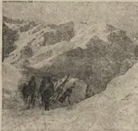
Tatry w szacie zimowej

Oto są przyczyny rozterek duchowych tego „wielkiego meża“ stanu który swą polityką zepchnął Litwę do stanu państw poprostu dzikich.