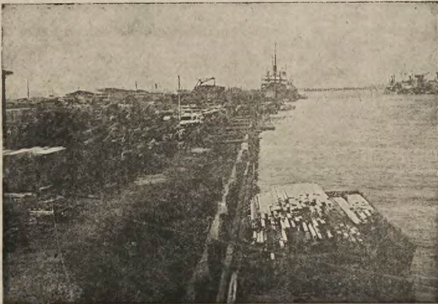
Składy drzewa w porcie Gdańskim.

Poselstwo stwierdza jednocześnie, iż dotychczasowe wycieczki amerykańskie do Polski przyczyniły się bardzo dodatnio do kształtowania się przychylniej opinii obywateli amerykańskich.