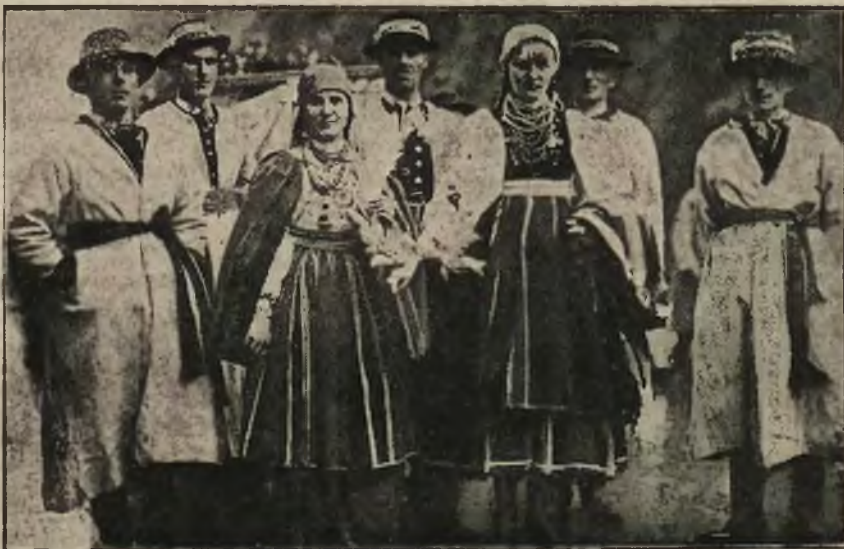
Malownicza grupa Łowiczan na uroczystościach 11 listopada.

W czasie III Zjazdu członków Tow. Lekarskiego woj. nowogródzkiego, firmy: Klawe, „Motor“ i Spies urządziły wystawę przetworów farmaceutycznych. Narzędzia chirurgiczne wystawiła firma St. Baran ze Lwowa. Zjazd zakończony został bankietem, wydanym na cześć gości przez Tow. Lekarskie w Baranowicach. Zebrani wysłali depeze hołdownicze do P. Prezydenta Rzeczypospolitej i Marszałka Piłsudskiego.