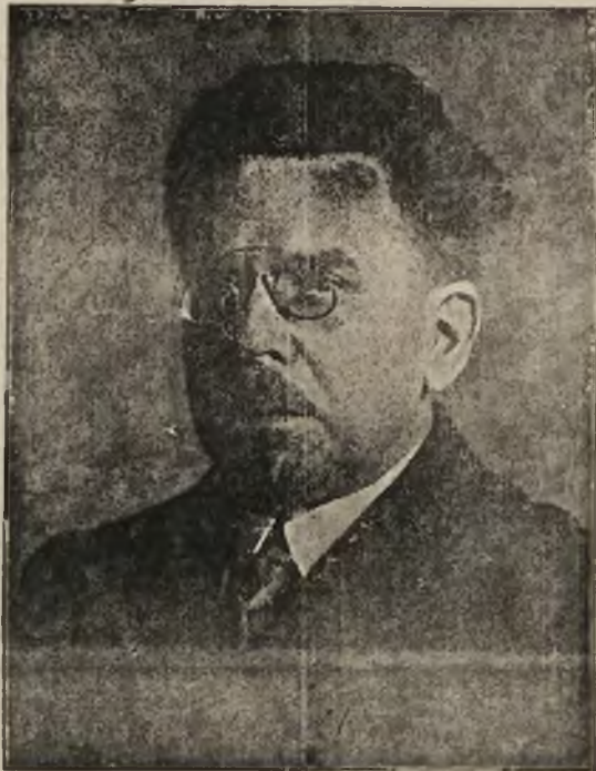
Władysław St. Reymont

Natura artystyczna pcha go w objęcia sztuki dramatycznej, przy-łącza się do trupy aktorów, by z