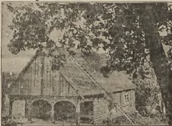
Chata z podcieniami w Sokolowie (Małopolska).

W ciągu ostatniego półrocza znacznie się wzniósł wywóz chmielu polskiego do Francji, jak na to wskazują dane statystyczne izby handlowej polsko-francuskiej.