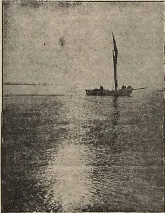
Wyjazd na połow...

i zdolności eksportowej kolei wyrze wykończenie nowej wielkiej linii kolejowej, łączącej Górny Śląsk z Gdynią. — Obecna zdolność przeladunkowa przedstawia się następująco: przez Gdańsk przeszło w październiku 395 000 tonn węgla, w Gdyni załadowano 94.000 tonn, a w Tczewie 16.000 t.