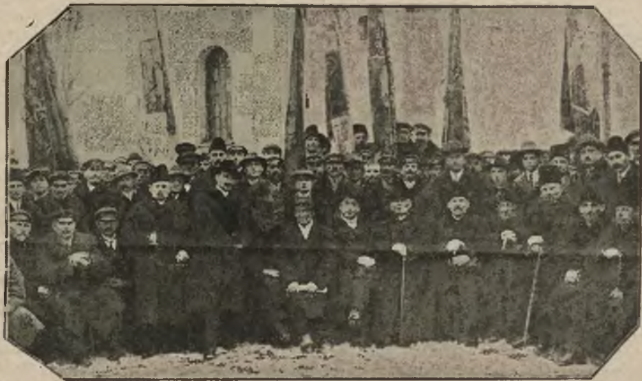
Uczestnicy Zjazdu rzemieślników powiatu pułtuskiego.

Ogólnie obrady Zjazdu miały przebieg bardzo poważny. Rzeczowa dyskusja stwierdziła, że rzemieślnicy powiatu pułtuskiego doceniają znaczenie nowej Ustawy dla rozwoju rzemiosła a przez nie i dla Państwa. Zjazd zamknięto gorącym wezwaniem do żywej współpracy uświadamiająco - propagandowej.