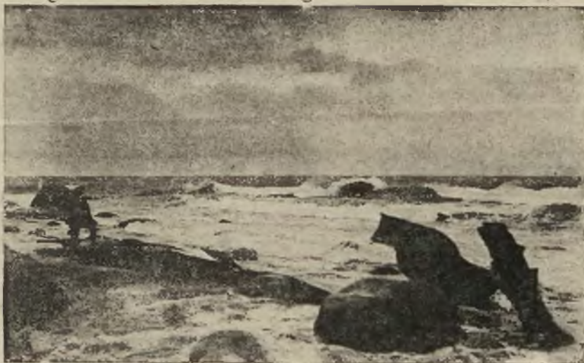
Wybrzeże morza Śródziemnego na wschód od Gibraltaru.

Dopiero nad ranem, powracający żołnierze napotkali w gąszczu tuż na skraju lasu, w olbrzymiej kaluży krwi dwie krowy, przeszyte licznymi kulami.