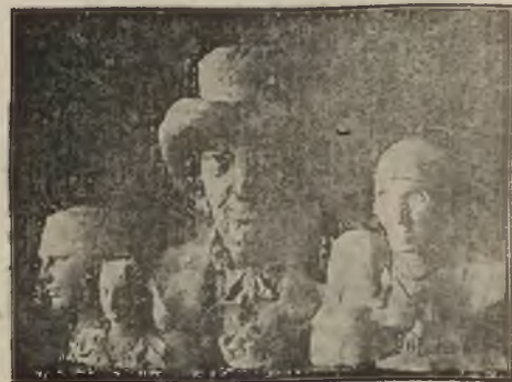
Dziela rzeźbiarskie Petryny

Mamy nadzieję, że znajdzie się ktoś kto powiezy pana starostę, że jednak pamiątki po Mistrzu są cenniejsze od kilku tonn węgla.