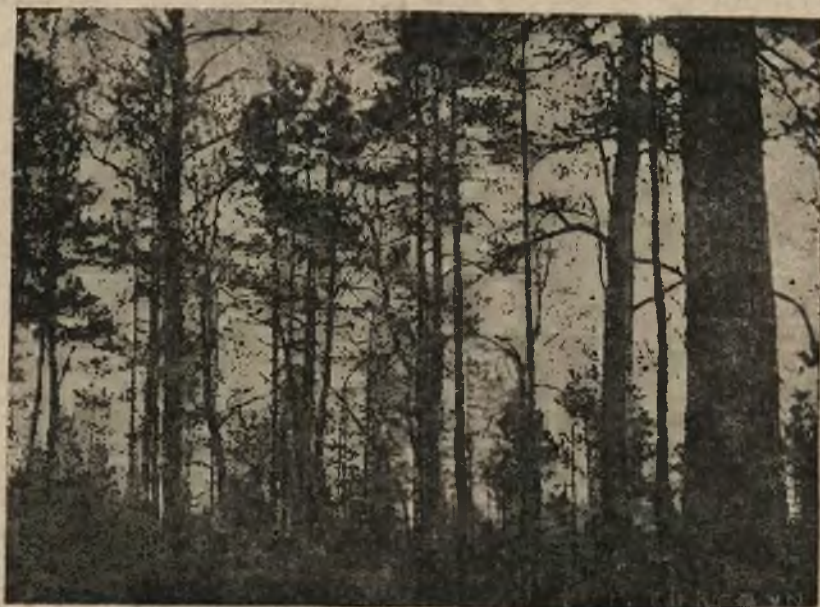
Fragment z lasów pod Bersztami (Woj. Wileńskie).

Dnia 8 grudnia ukazało się w Monitorze Polskim rozporządzenie p. Prezydenta Rzeczypospolitej z dnia 8 listopada 1927 roku wprowadzające jednolity monopol sprzedaży soli na obszarze Rzplitej. Rozporządzenie to zmienia rozporządzenie z dnia 30 grudnia 1926 r. oobowiązujące w tej materji.