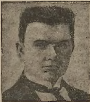
PREMIER LITEWSKI WALDEMARAS. (Patrz str. 3: „Wojna czy pokój“).

ga Polski „sejmowładztwo“ i „ liberum veto “ — „Nie pozwałam“.