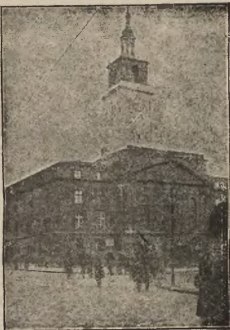
Starożytny (obecnie przerobiony) ratusz w Wieluniu.