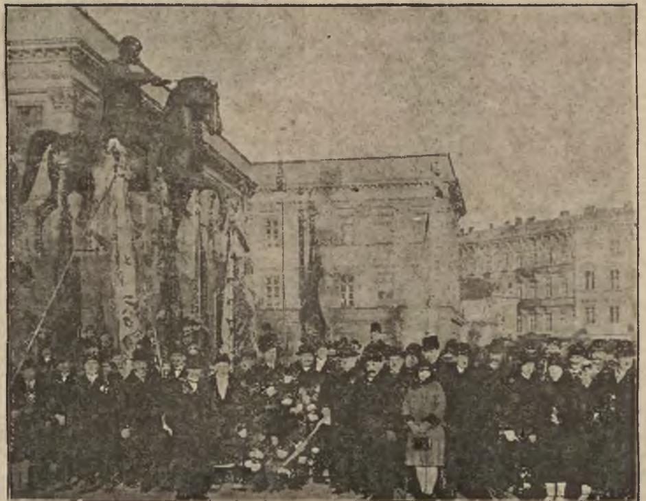
Uczestnicy Zjazdu Kuchmistrzów przed złożeniem wieńca na grobie Nieznanego Żołnierza.

Obecnie, po zaliczeniu kuchmistrzostwa do ustawy przemysłowej, przystępuje ono do organizowania się. Pierwszym etapem na drodze do organizacji było zebranie kuchmistrzów całej Polski, które odbyło się w dniu 8 grudnia b. r. w Warszawie.