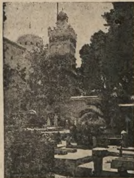
Cmentarz mahometański przy jednym z klastorów w Fezie.