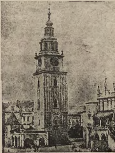
Wieża starożytnego ratusza w Krakowie.

1) Zebrani tworzą Komitet Zjednoczenia Gospodarczego Województwa Tarnopolskiego.