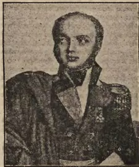
GEN. JÓZEF BEM.

Lecz zmęczony ciągłą walką i zawodami życiowymi umiera gen. Józef Bem, marszałek polny turecki, obrońca wolności, jeden z tych Polaków co po całym świecie siali swe kości, modlą się i pracując o mickiewiczowska „wojnę ludów”.