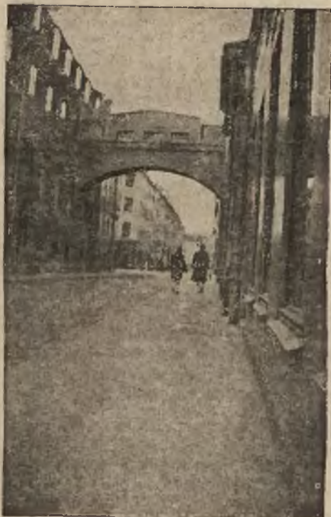
Jedna z ulic starego Hamburga.

Gabinet socjalistyczny podał się do dymisji z powodu powzięcia przez parlament decyzji w kwestji taryf celnych, sprzecznej ze stanowiskiem rządu.