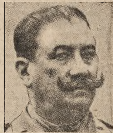
General Damasco Berenguer

Chef des Militärkabinetts, der als Nachfolger Primo de Riveras zum spanischen Ministerpräsidenten ernannt wurde. General Berenguer gilt als ein Vertrauensmann des Königs Alfons.