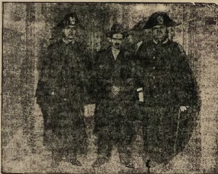
Pierwszy przestępca, aresztowany przez policję papieską w państwie tybetańskim za obrabowanie skarbonki