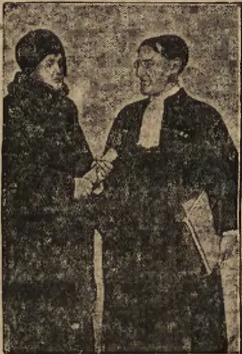
Żona zaginionego w tajemniczy sposób jenerała, rozmawia z adwokatem w celu wniesienia skargi przeciwko nieznanym sprawcom.