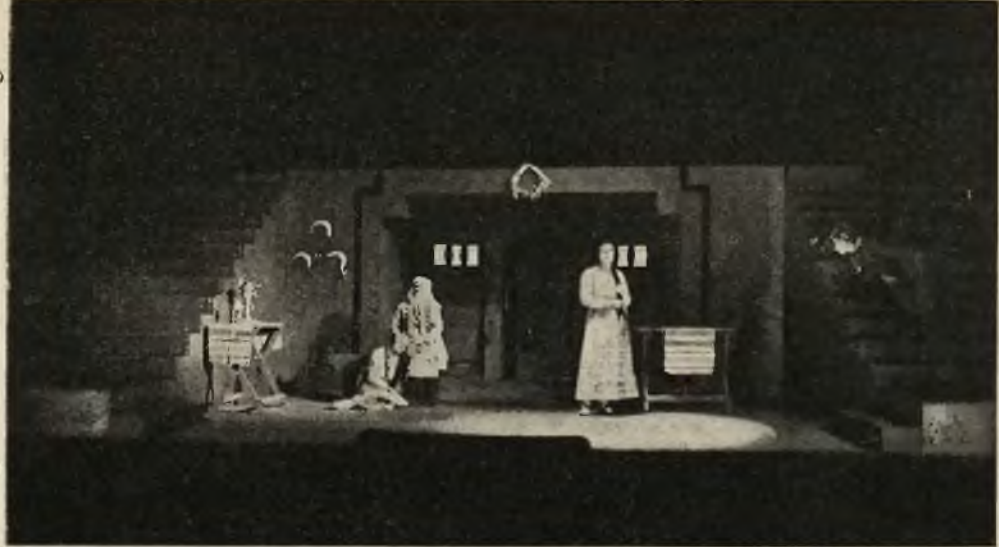
Ciekawa inscenizacja „Balladyny” w teatrze Polskim w Poznaniu.