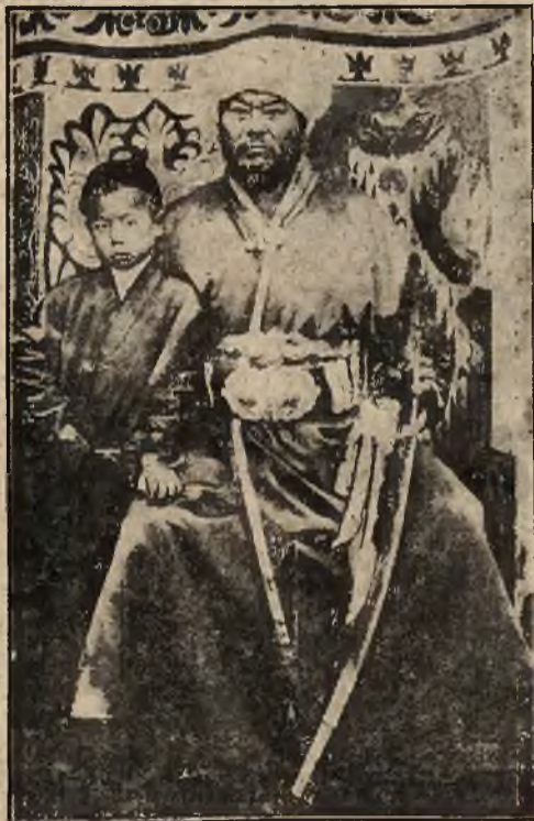
Wójt gminy w Ferganie (typ mongolski).

niając Europę przed najazdem mongolskim poległ z licznym rycerstwem śmiertelnie bohaterską Henryk Pobożny. Nie rachując mniejszych napaści jeszcze dwa wielkie napady turecko-mongolskie zapisała historia nasza w latach 1259 i 1287; szczególnie ciężko dotknął kraj napad pierwszy, kiedy spalono Lublin i Kraków, zdobyto Sandomierz i pomordowano wiele ludności.