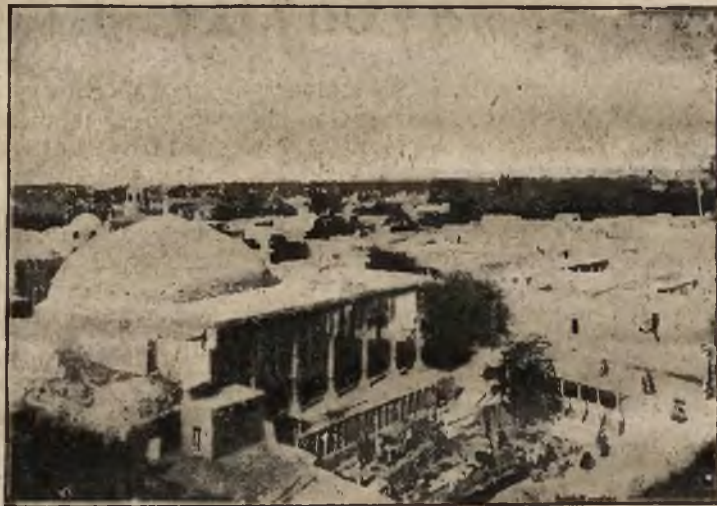
Nur-ata, miasto w Bucharze