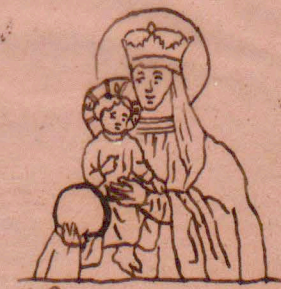
i) Bizantyjska (w Kijowie)