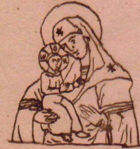
d) Cypryjska 23 Nihoka 301 Tosiwa (Eleusa)