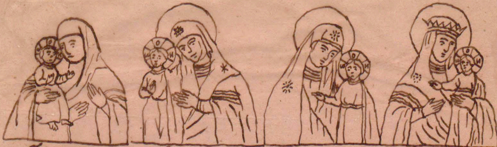
n) Trojczana z Athos g) Pietruska w Moskwi p) Kazanska w Moskwi q) Sobolska