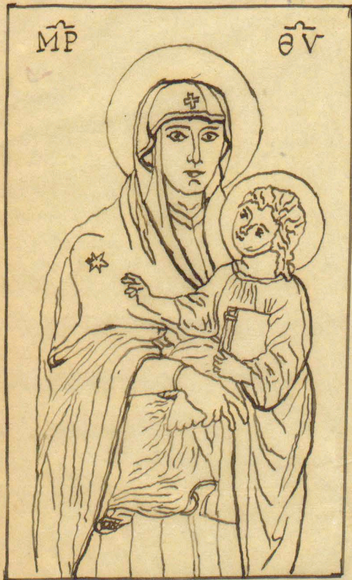
n. P. Maria malowana przez S. Lukasa w Trymie w bazylice S. Mariae Majoris.