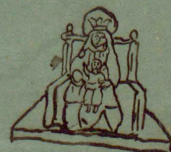
Warteniska na Slezku.