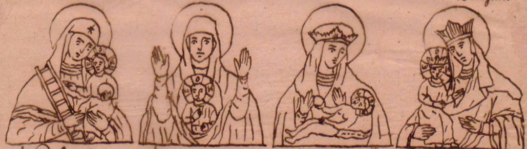
w) Lutylowska x) Znamenie Nowgorodska y) Umienie z) Nowgorodska