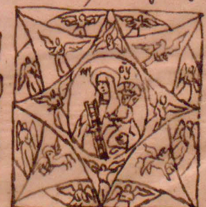
g) Wicynie gorjacy Kirza K.