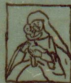
Chlumcka (Kopia Lesnaufkiej) w Czechach.