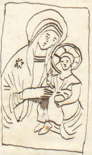
Obraz P. Maryi malowany przez S. Lukasa w Trymie w Kofuiele S. Maria de Cosmedin Rqincourt Sect III Tab. CV nr II.