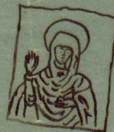
Dvaska w katedrze S. Lukasa w Czechach.