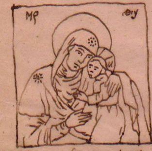
k) Efezka (Korsunijska) w Toroncu (z bogactwem wizerunka)