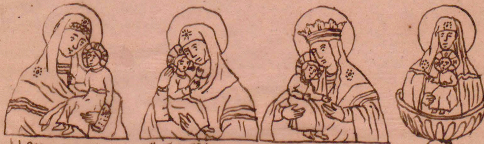
r) Muromska z r. 1291. s) Seodskaja z r. 1164. t) Kijowska bracka u) Zywonosnyj i stoznik