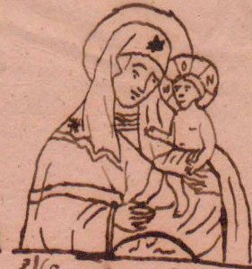
c) (Cypryjska Odigitria)