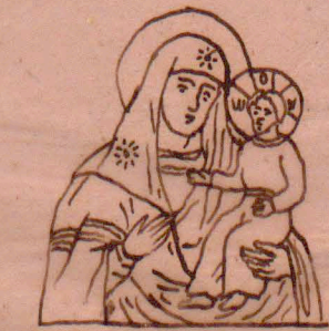
l) Smoleńska (Odigitria) (Taka sama jak Efezka)