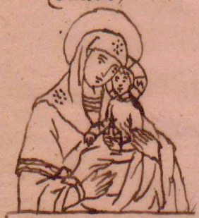
g) Carogrodzka Fitermfka