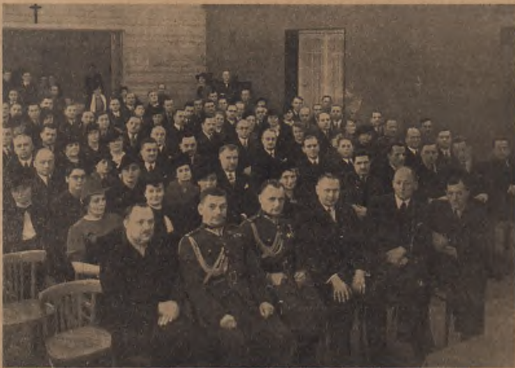
UCZESTNICY OBCHODU Z OKAZJI 20-LECIA NIEPODLEGŁOŚCI I PRZYŁĄCZENIA ŚLĄSKA ZAOLZIAŃSKIEGO DO POLSKI W DOMU HARCERSTWA W WARSZAWIE W DNIU 15 GRUDNIA 1938 R.

Harcerstwo mogło rozwijać się w tym czasie, gdyż ideowe organizacje młodzieży polskiej, które stały na stanowisku walki orężnej o Niepodległość, uważały za konieczne stosowanie przymusu odnośnie swoich członków odbycia wyszkolenia fizyczno-wojskowego.