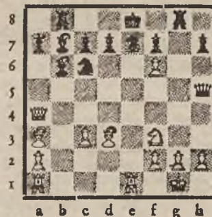
Zadanie 28. (kombinacja)

Białe: K e2, G f8, S b4, p b3, g7. Czarne: K a3, p b6.