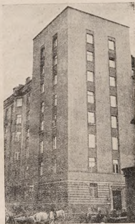
7 piętrowy gmach Dyrekcji Kolei Państwowej w Warszawie. Wszystkie ścianki działowe z SOLOMITU.

Solomitu przez fabrykę w Katowicach, która pracując krajowym kapitałem, robotnikiem i surowcem da nam