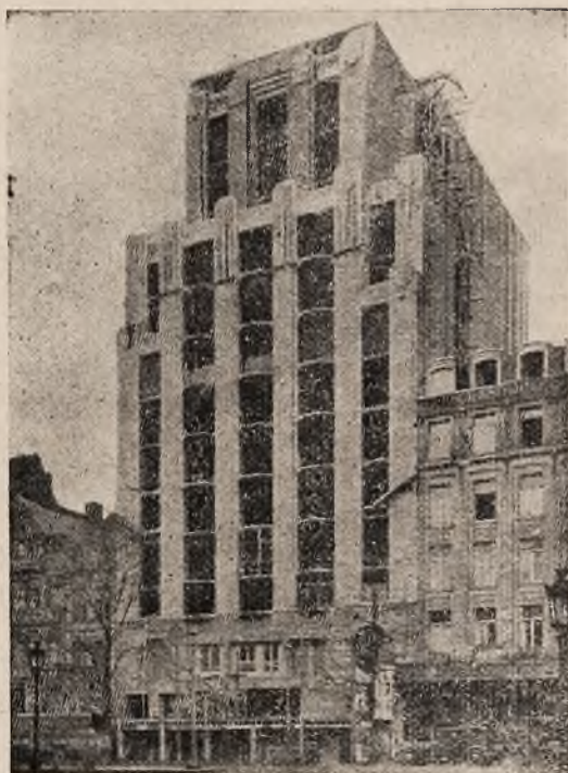
Hotel „Century“ w Antwerpii. Do budowy użyto 50 tys. m 2 SOLOMITU.

Są to płyty ze słomy prasowanej pod wysokim ciśnieniem, związanej drutem stalowym, ocynkowanym, impregnowane specjalnym płynem Etimolesem. Słoma, materiał, który od lat służy nam jako materiał bu-