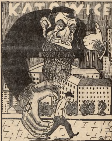
Żyd przybłąda, opanowawszy Katowice, sięga swą łapą po ostatnią oliwę.

Tych ludzi, którzy zdolni i gotowi są już dziś przyjąć walkę otwartą o swe przekonania, posiada tylko Stronnictwo Narodowe, posiada Oboz Wszechpolski i tacy ludzie wychodzą tylko z szeregów Obozu Narodowego. W pracy takiej, w pracy prowadzonej dla dobra kościoła, dla dobra narodu, niech nam nie przeszkadza