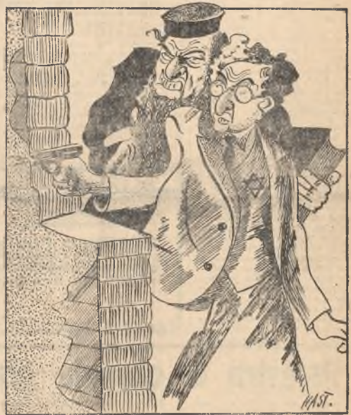
Taką to bronią walczą żydzi przeciwko nam.

Alie chodzi o to, że sam fakt decydo-wania o obliczu władz adwokatury przez obcych i to żydów jest dla każdego praw-dziwego Polaka nie do zniesienia.