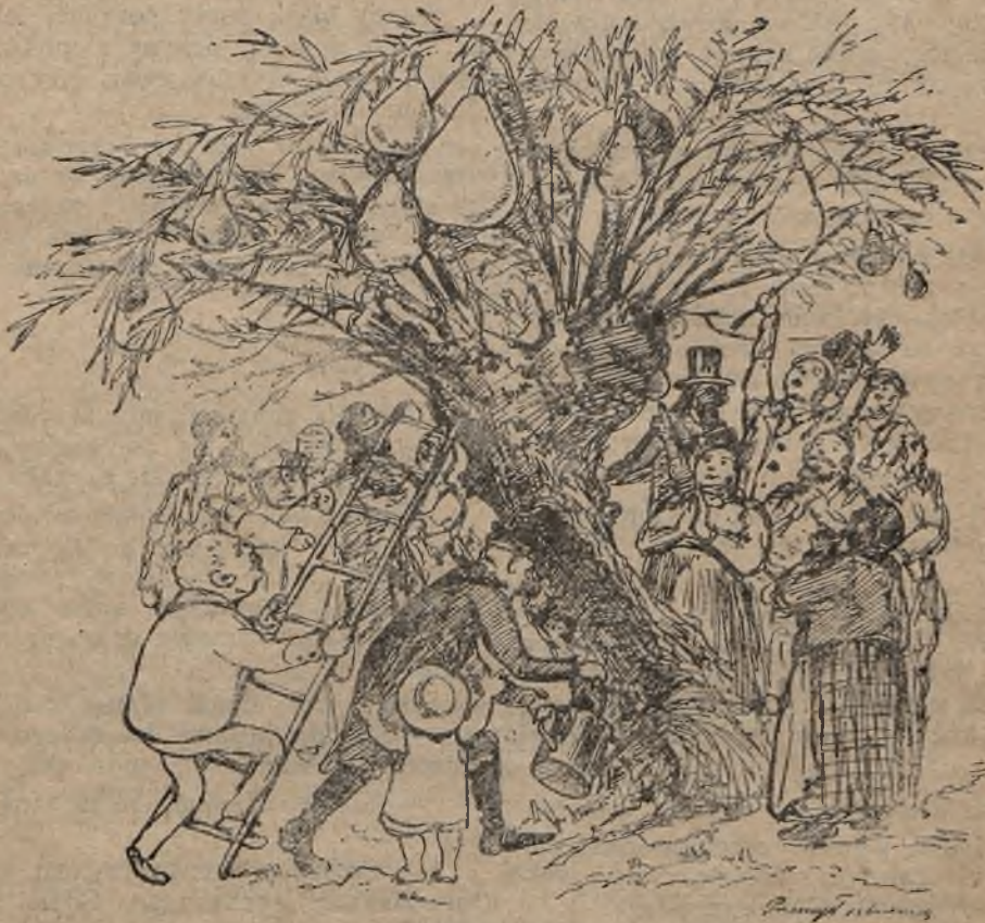
Jak sobie wyobraża mały Adaś, syn radcy — enuncjację rządu w sprawie podwyżek płac urzędniczych.

Służący wyszedł. Pani Rena patrzała przez okno. Przed hotel zajechał dobrze jej znany automobil. Portjer wybiegł, otworzył drzwi. Wszedł jej mąż!