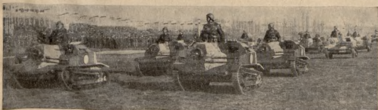
Sojusz Polski z Francją opiera się na silnej armii.

POLSKA I FRANCJA. — O nową ordynację wyborczą. — Możemy zbudować szkoły dla miliona dziatwy polskiej. — Pochód Japonii. — Niebezpieczeństwo w przestworzach. — RZECZ O FUDZE. FATALNA POMYŁKA.