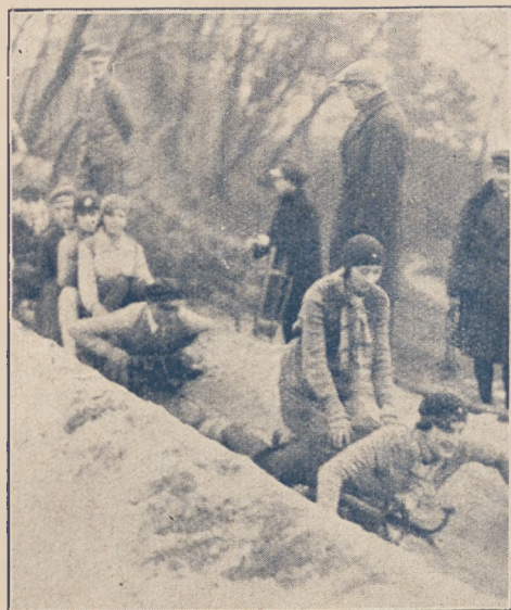
Z warszawskiego toru saneczkowego.

Sekcja hokejowa Warszawskiego Towarzystwa Łyżwiarского wystąpiła z WTŁ. na skutek zatargu z zarządem towarzystwa na tle wyłącznie organizacyjnym.