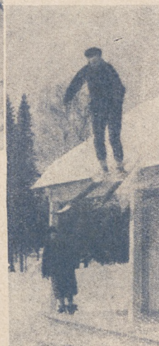
Ciekawe „kawalki” narciarskie w St. Moritz. Kominarz na nartach — skok z dachu.