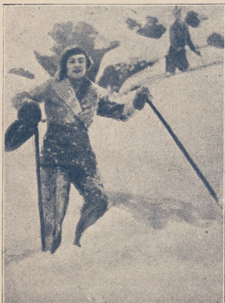
Słynna tenisistka Lilly Alvarez na nartach.