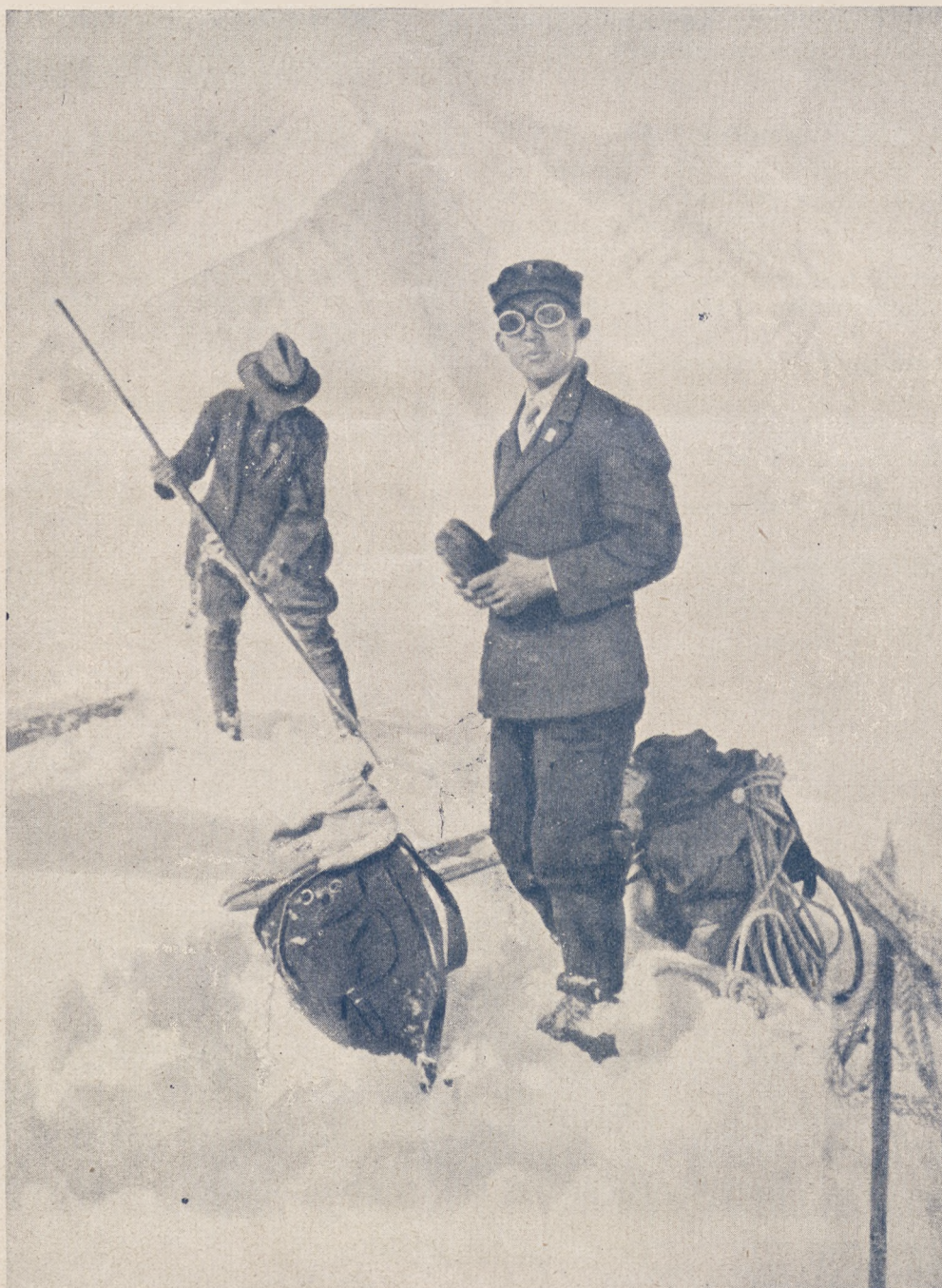
Japoński turysta na wycieczce narciarskiej w Alpach.

W Zakopanem rozegrane zostały 2.II zawody narciarskie dla młodzieży, składające się z biegów zjazdowych. Oto wyniki: bieg 300 mtr. (do lat 9): — Józef Polankowy; bieg 500 mtr. do lat 10 — K. Motyka; bieg 1 klm. do lat 11 — Czarmak; bieg 2 klm. do lat 12 — Obrochta; bieg 3 klm. do lat 15 — Hoży; bieg juniorów 6 klm. do lat 18 wygrał Dawidek 25:28 przed J. Maruszem 25:37.