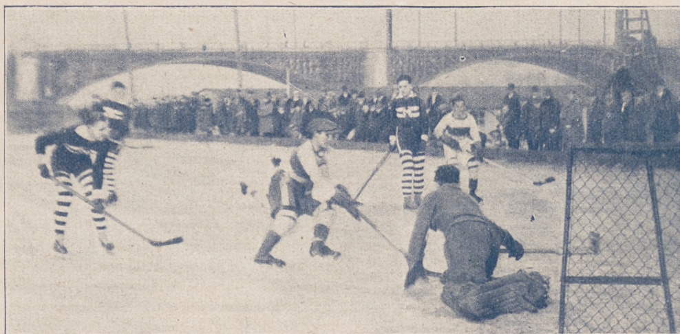
Z meczu hokejowego AZS. — gimn. Mickiewicza.

Polski Zw. Hokeja Lodowego utworzył podokręgi w Łodzi i na Śląsku.