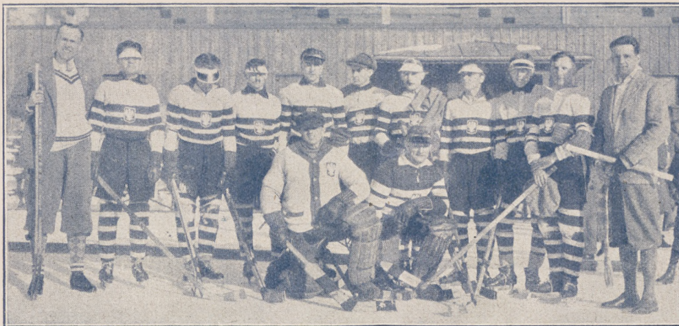
Polska reprezentacja hokejowa w r. ub. w Davos.