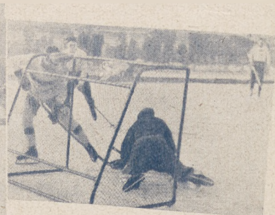
WTŁ. — Nadwiślanka.