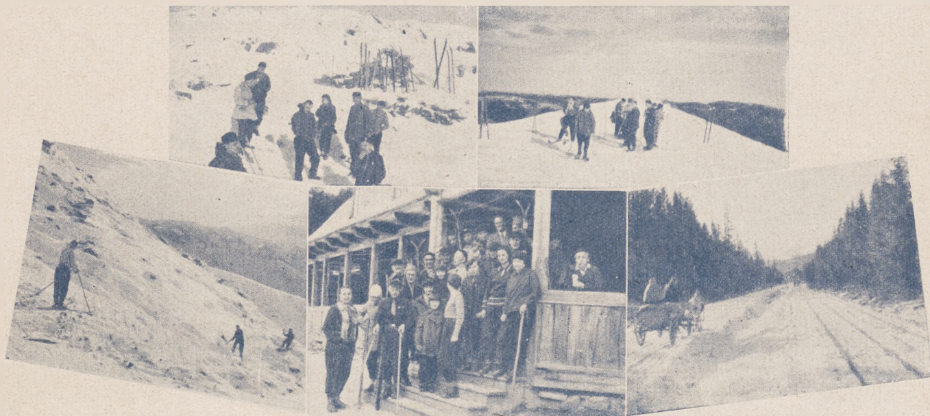
Fragmenty wycieczki narciarskiej w Czarnohorze.

U góry — drogi na Howerlę, na lewo — stok Howerli, w środku — uczestnicy wycieczki przy schronisku na Zaroślaku, a na prawo — droga z Worochty do Zaroślaka.