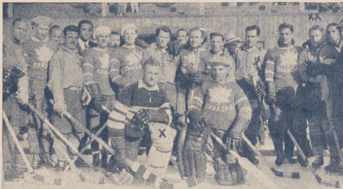
Drużyny Kanady i kombinowanej repr. Europy przed meczem.