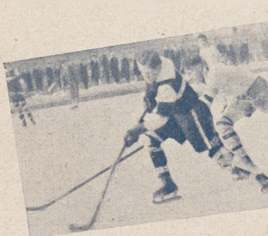
Polonia — gimn. Ziemi Mazowieckiej.