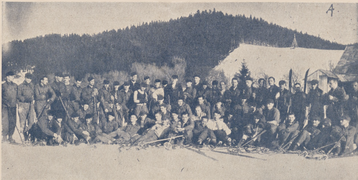
Grupa męska Centralnego Instytutu W. F. na kursie narciarskim w Krynicy.