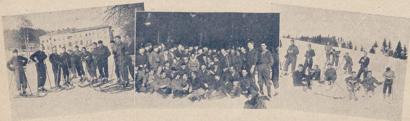
Fragmenty z kursu narciarskiego Centralnego Instytutu W. F. w Krynicy.

Niewiele dni przejdzie — mistrzostwa odbędą się w dniach 12 — 16 lutego — i będziemy wszystko wiedzieli. Czekajmy więc cierpliwie, względnie niecierpliwie szykujmy się do wyjazdu w Tatry, gdzie Polski Związek Narciarski z jednej strony, a tak ruchliwe Towarzystwo Przyjaciół Zakopanego, z drugiej — uczyniły już wszystko, by nikt z pobytu nie wyniósł wspomnień innych, niż radosne.