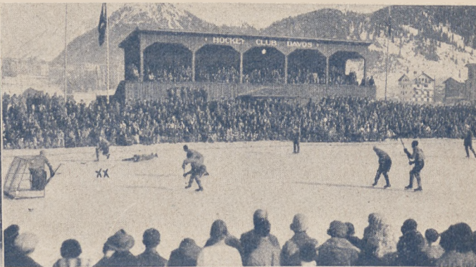
Fragment meczu hokejowego w Davos Kanada — Europa 9:0.