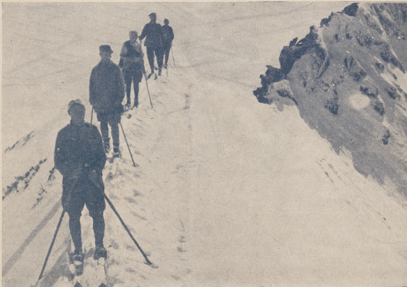
Warszawscy turyści - narciarze na Grani Kasprockiego Ukrocia.