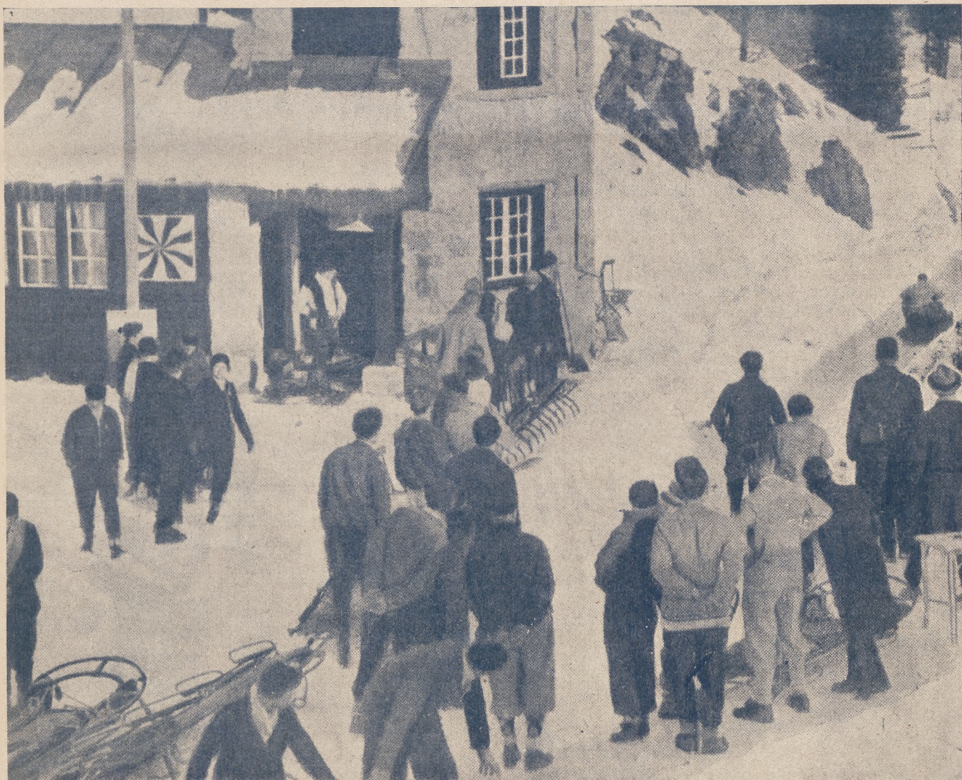
Start zawodów saneczkowych w St. Moritz.

O czwarte miejsce odbył się w Wiedniu 5.II mecz Austria — Polska z wynikiem 2:0 dla Austrii, przyczem obie bramki padły w 3-ciej tercji. Dnia 6.II Polska przegrała z Kanadą 0:5 i drużyna wróciła do kraju.