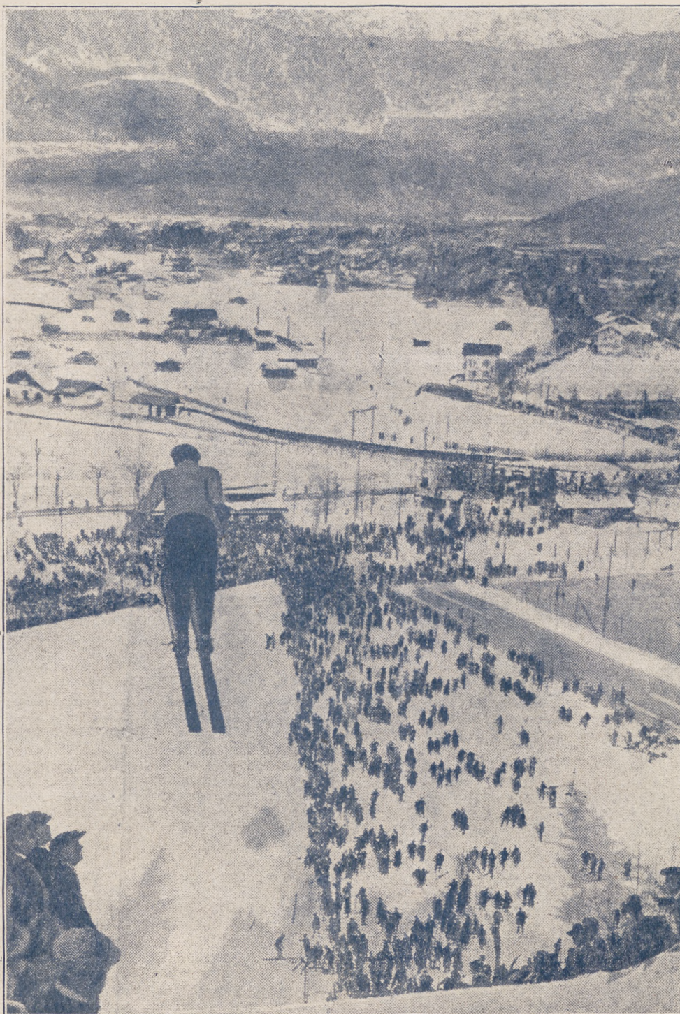
Konkurs skoków w Partenkirchen (Bawaria).