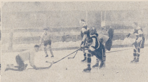
Z zawodów hokejowych w Warszawie.