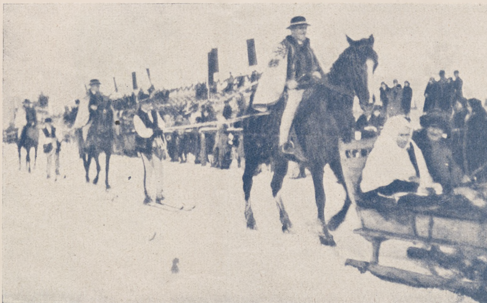
Przed startem zawodów skikjöringowych w Zakopanem.