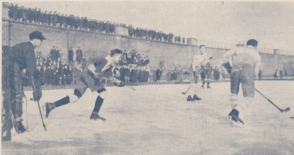
Mecz hokejowy AZS. — Warta (3:1) w Poznaniu.