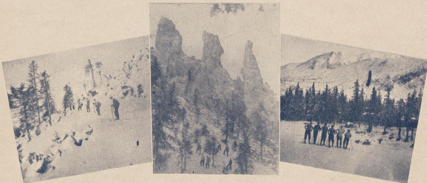
Momenty z wycieczki narciarskiej gimnazjum w Zgierzu.

W Krynicy rozegrane były 18—19.I zawody narciarskie o mistrzostwo Krynicy, składające się z biegu 16 klm. dla senjorów, biegu pań i konkursu skoków. Wyniki zawodów były następujące: bieg 16 klm. senjorów — 1) Żytkowicz 1:14.04, 2) Skotnicki 1:29.55, 3) Kochański 1:30.52, 4) Bukowski 1:32.39, 5) Cisowski 1:33.37; bieg pań 8 klm. — 1) Skotnicka 38:34, 2) Gruczelakówna 43:52, 3) Mallówna 44:20, 4) Burdówna 46:4. Konkurs skoków, rozegrany na małej skoczni, dał wyniki: 1) Żytkowicz skoki 23 i 22 mtr., nota 18.950, 2) Bukowski skoki 16 i 15 mtr., nota 14.135, 3) Krechel skoki 19 i 21 mtr., nota 12.040, 4) Skotnicki skoki 16 i 18 mtr., nota 11.405. W kombinacji (bieg i skok) o mistrzostwo Krynicy wygrał bezkonkurencyjnie Żytkowicz 19.475, 2) Bukowski 12.805, 3) Skotnicki 11.765, 4) Golańczuk 8.017.