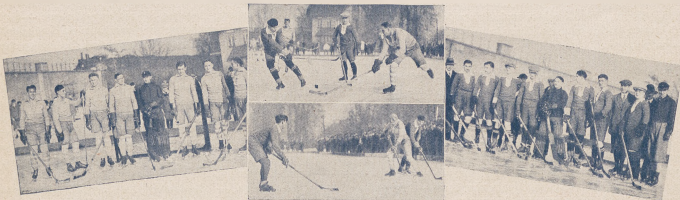
Drużyna AZS. Poznań.