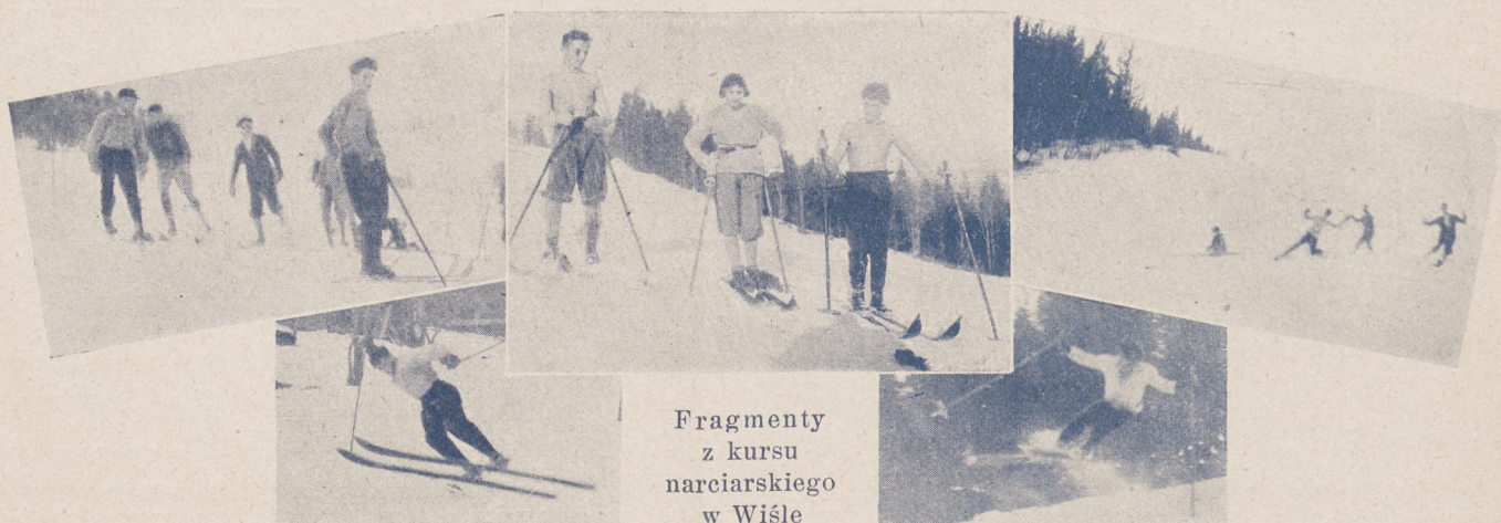
Fragmenty z kursu narciarskiego w Wiśle