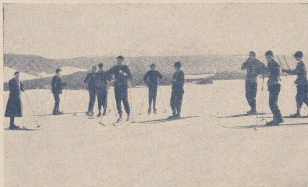
Pierwsze treningi w górach.

— Polski Zw. Hokeja Lodowego otrzymał szereg zaproszeń dla naszej reprezentacji, jednak z zaproszeń tych nie będzie można skorzystać ze względu na przygotowania drużyn do mistrzostw świata oraz ze względu na terminy zawodów krajowych. Ostatnio nadeszło zaproszenie z HC. Milano i LTC. Praga. Wyjazd do Włoch okazał się jednak w roku bieżącym niemożliwy, natomiast propozycja spot-