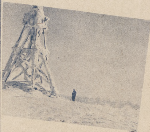
Na trasie wycieczek narciarskich.