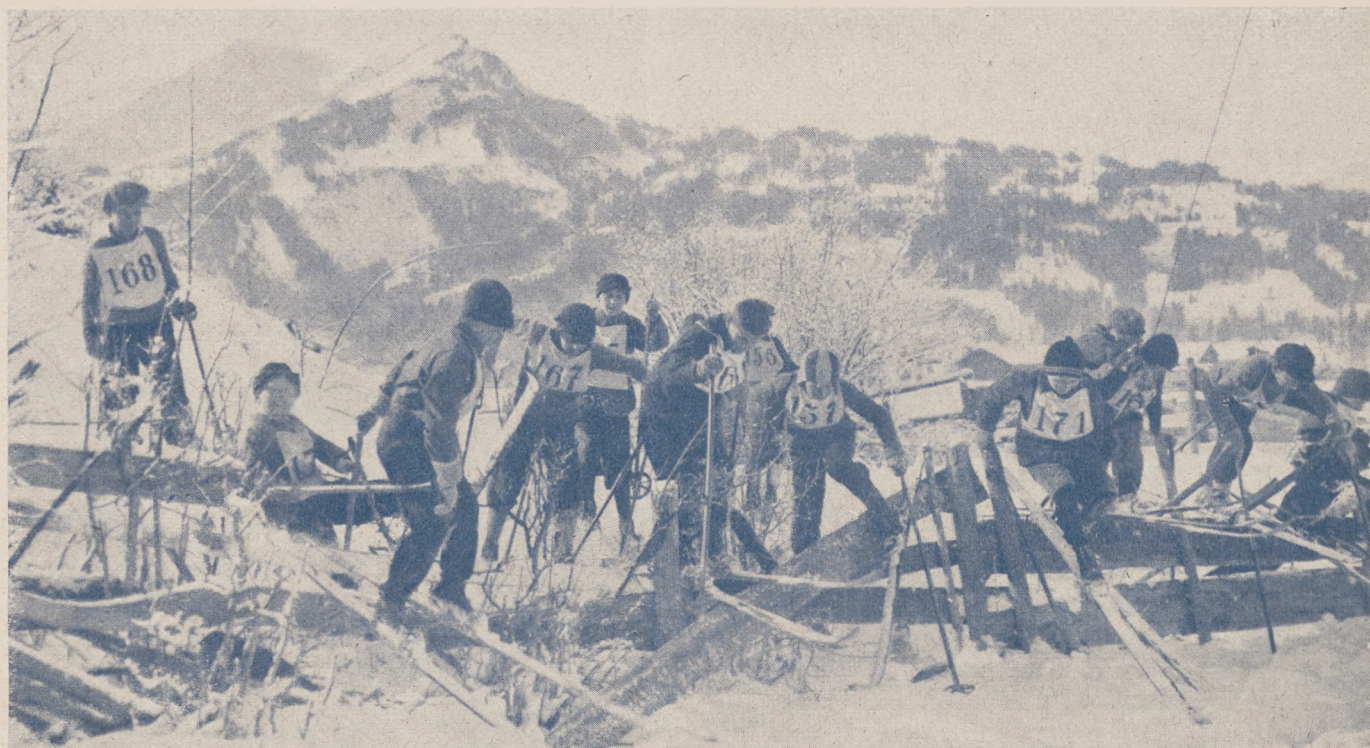
Młodociani narciarze na przeszkodzie podczas zawodów szkolnych.

Śląskie tereny narciarskie nadają się specjalnie do biegów długich, dzięki swej różnorodności i zmienności charakteru trasy i przez to są bardzo zbliżone do terenów norweskich.