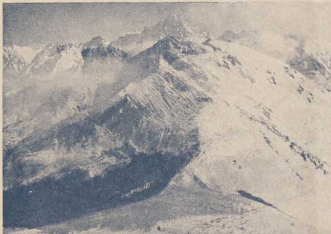
Tatry w śniegu.