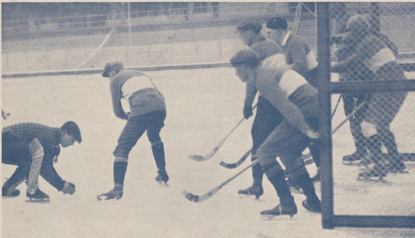
Charakterystyczny moment meczu bandy, najpopularniejszej gry zimowej w Skandynawji.

§ 1. Boisko ma być o kształcie prostokąta, którego długość jest w obrębie 90—110 mtr., szerokość 45—60 metrów. Przy meczach międzypaństwowych i o mistrzostwo minimalne wymiary powinny być: 105 m. dł. i 55 m. szerokość.