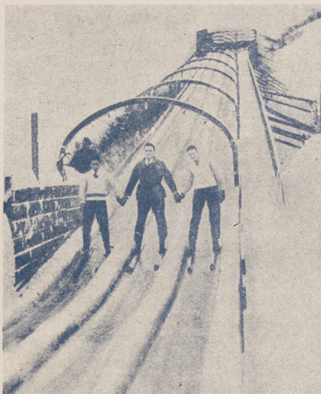
Narciarze na sztucznym torze saneczkowym w Lake Placid (Kanada).

Rok 1931 zgromadzi z pewnością największą ilość współzawodników i będzie godnym ukoronowaniem wieletnich walk.