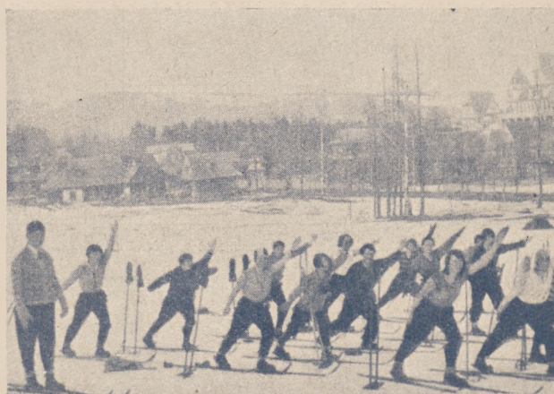
Uczestniczki kursu narciarskiego w Zakopanem podczas zaprawy.