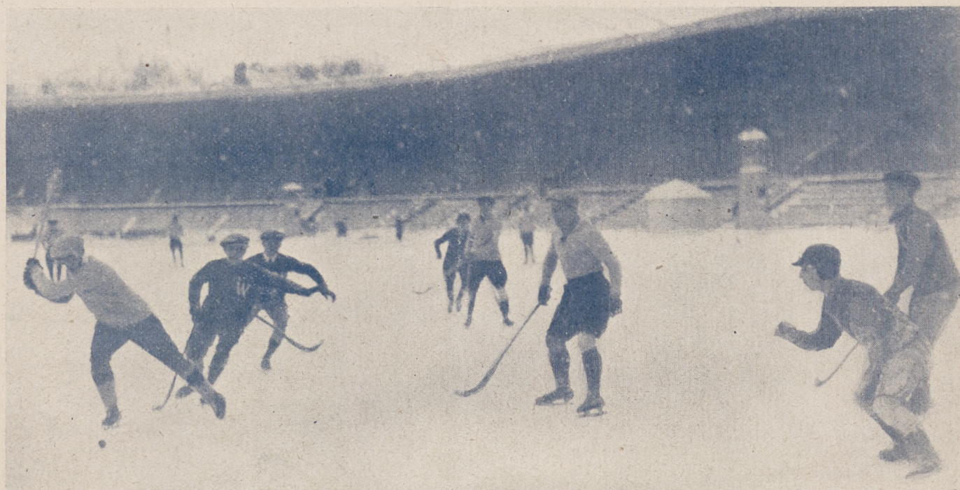
Mecz hokeja-bandy w stadjonie sztokholmskim.

Bo otóż miałyby „coś do roboty” zimą, obserwując podobną grę w piłkę lecz na lodzie i jeszcze weselszą, bo szybszą w kombinacji i bardziej uprzywilejowaną pod względem kopania. Znając z piłki nożnej zasady, publiczność nie potrzebowałaby się uczyć i zatem z satysfakcją, hurmem przerzuciłaby się na ten zimowy sport, kontynuując nadal swe zainteresowanie i zamiłowanie dla sportu, któreby już jako tako zeszło z jednego kopyta.