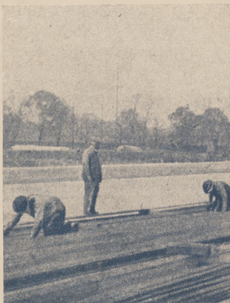
Ostatnie roboty na torze sztucznym w Katowicach.

Poniedziałek 8 grudnia, godz. 12: pokaz łyżwiarski i mecz hokejowy AZS. — Legja. Godz. 17: pokaz łyżwiarski i mecz Pogoń — TEV. (Opawa).