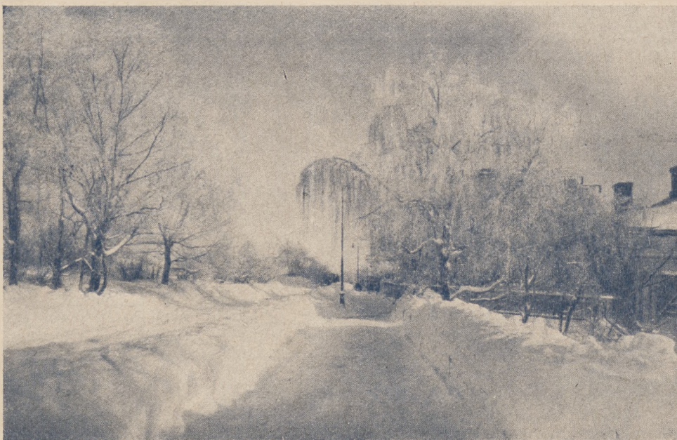
Piękny zimowy obrazek z Finlandji.