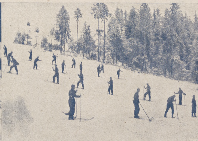
Dwa fragmenty z wojskowego kursu narciarskiego w Krynicy.