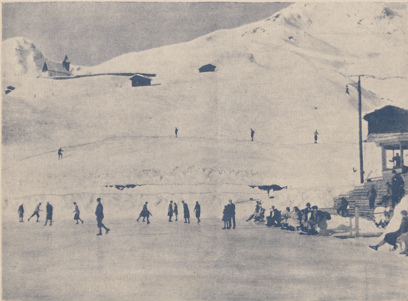
Wspaniale położona ślizgawka w Arosa (Szwajcaria).