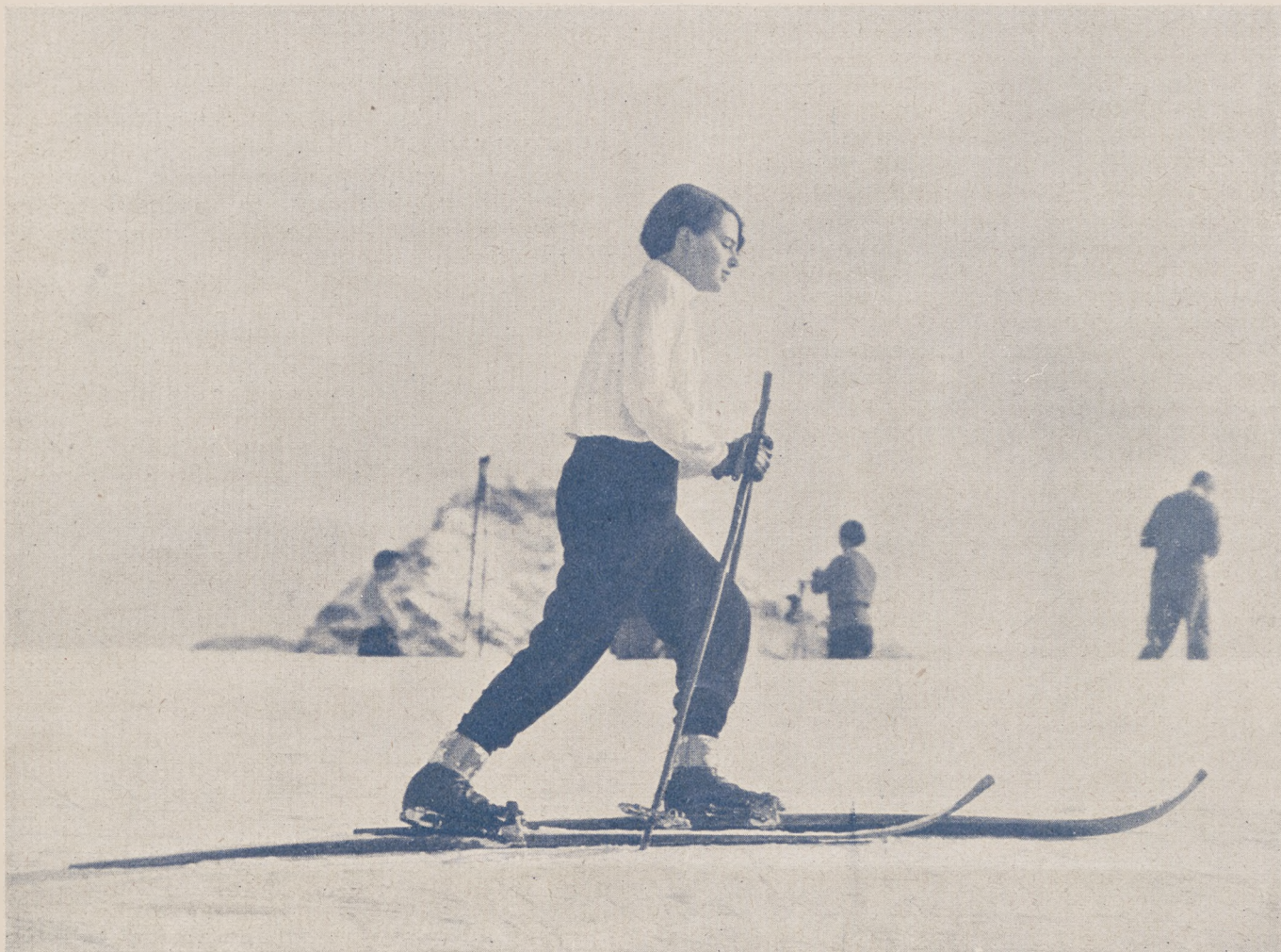
Na nartach w góry.