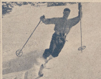
Trzy fragmenty ewolucyj narciarskich.