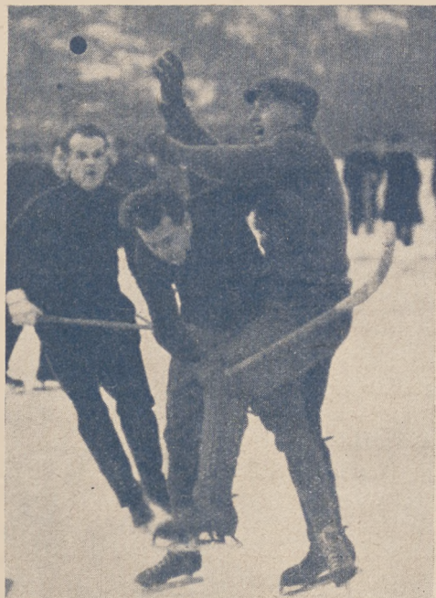
Podbramkowy moment meczu w hokej-bandu w Szwecji.

Boisko oznacza się wyraźnymi linjami. Strony dłuższe nazywają się liniami bocznymi, strony krótsze — liniami bramkowymi. Dwumetrową chorągiewkę umieszcza się na każdym rogu. Linja środkowa, przeciągnięta równolegle do linii bramkowych, dzieli boisko na połowy. Dla oznaczenia linii środkowej wbija się dwumetrowe chorągiewki w jej przedłużeniu z każdej strony, najmniej 1 m. od linii bocznych. Oznacza się również środek boiska.