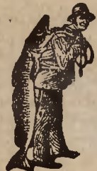
Falszywe tylko z powiatką marką, rybkiem, — jako pewną — znak wyrobem SCOTTA.

zawiera wymagane części składowe dla wzmocnienia kości i mięśni. Zaletą Scotta Emulsji jest, co też troskliwi rodzice w zupełności uznają, że bywa chętnie używaną przez małych pacjentów, dzięki swemu słodkiemu smakowi. Dzieci, którym nawet mleko nie służy, trawią Scotta Emulsję bez najuciążliwszych trudności.