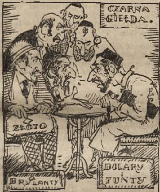
Ci, którzy „naprawiają” naszą walutę