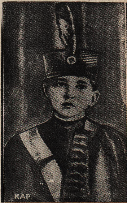
Piotr II. 11-letni król Jugostawii