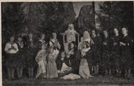
Z akademji ku czci Bł. Kingi

Upłynęło kilkanaście dni i znowu nadeszło święto Bł. Kingi. Stolica Święta wyznaczyła to święto dla Jej Zakładu na 16 bm. Kochana ogromnie, słodka, dobra, świetlana Święta! Wychowanki Jej szkoły złożyły Jej hołd przez uroczyste nabożeństwo, wspólną Komunię świętą i wieczorną akademię. Wzniosły panować w tym dniu nastroj, bo kochające dzieci obchodziły Imięni swęj Kochanej Matki. I u Jej stóp składały przyrzeczenia: „Będziemy dobre, jak Ty byłaś —