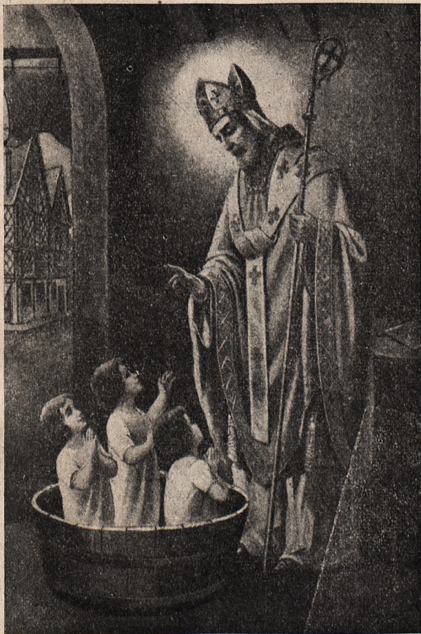
Święty Mikołaj wskrzesza zmarłe dzieci.