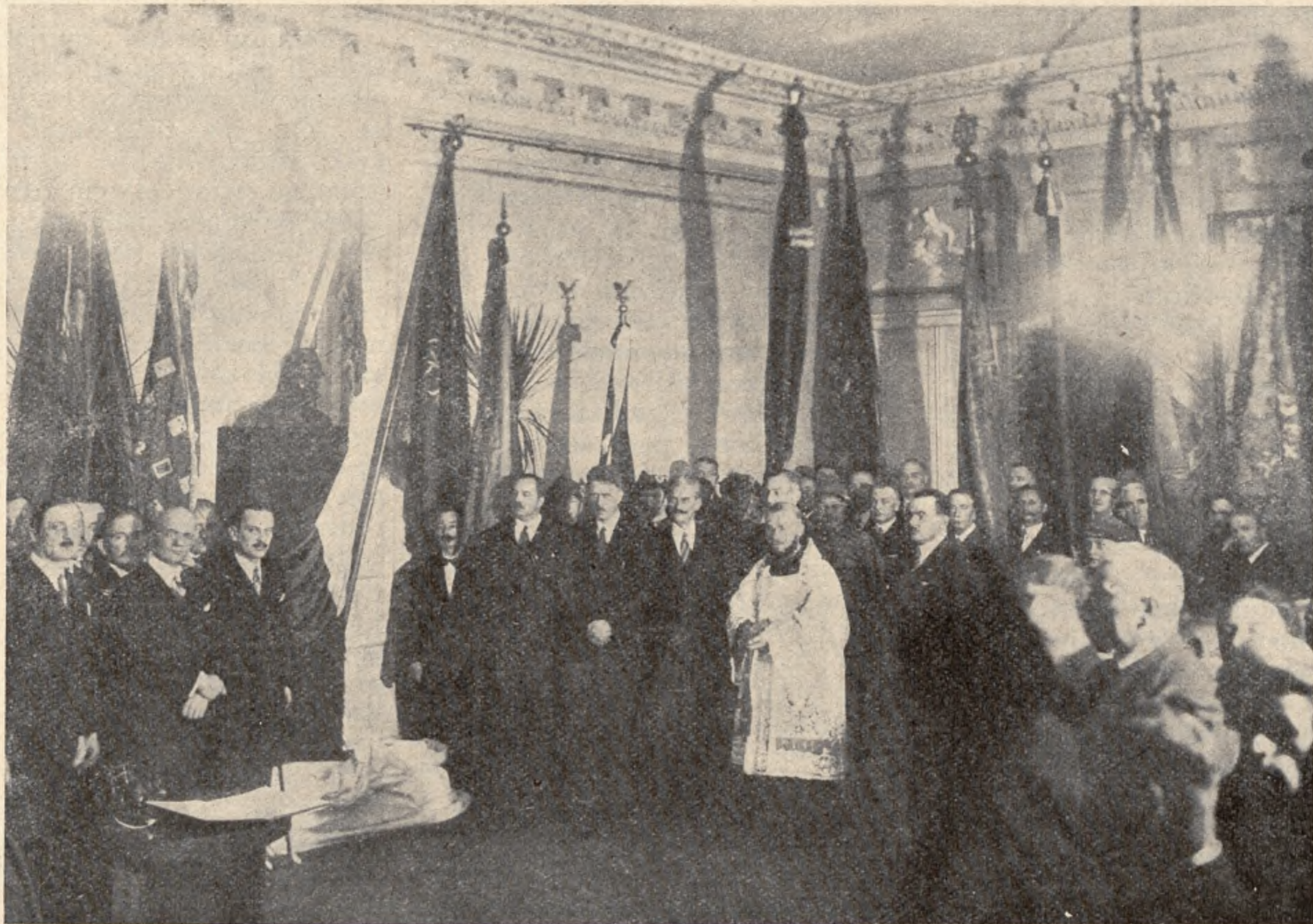
Uroczystość odsłonięcia popiersia ś. p. Marszałka Józefa Piłsudskiego w b. sali stiukowej Związku Rzemieślników Chrześcijan. w Warszawie.

miosła, a kiedy przed kilkoma laty jako Prezes Banku Gospodarstwa Krajowego raportowałem ś. p. Marszałkowi, iż z funduszków Banku uruchomiłem dla rzemiosła kilkanaście milionów kredytów, ś. p. Marszałek zaaprobował moją decyzję, mówiąc: „Dobrze uczyniliście, gdyż rze-