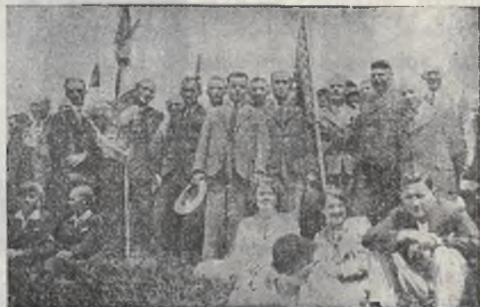
Sztandar Oddziału krakowskiego wspólnie ze sztandarem Zw. Legionistów na Święcie Morza w dniu 29. VI. br.