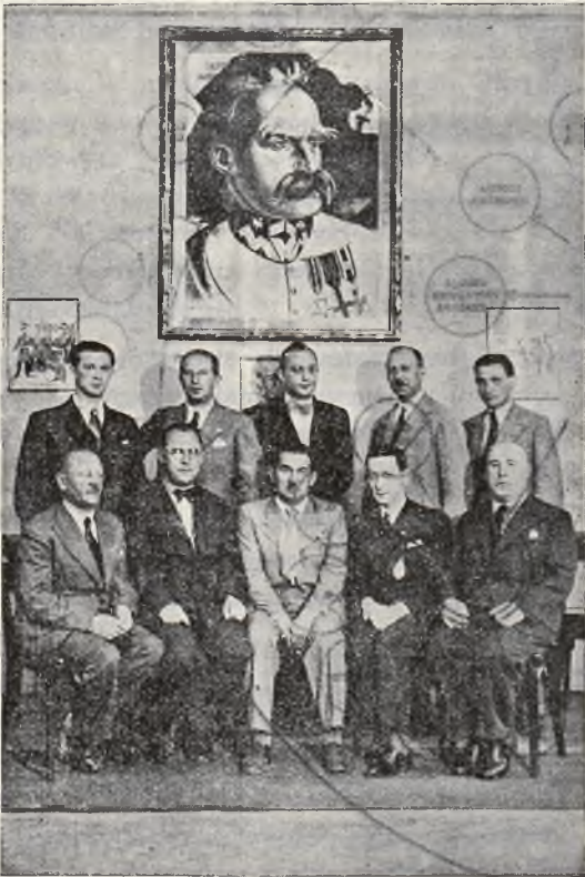
Zarząd Okręgu, wybrany na Zjeździe Delegatów