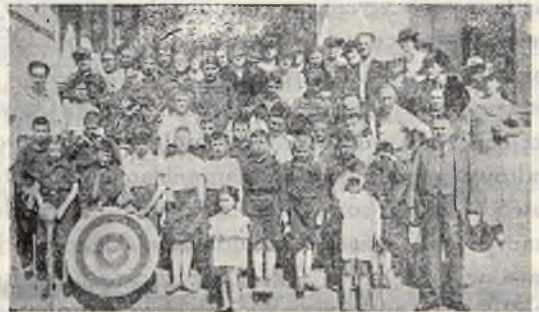
Nasza kolonja harcerska w Zawoju.