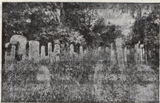
Groby wojenne przed uporządkowaniem.

2) Z wiosną 1935 r., tj. 15. maja przeprowadzono roboty konserwacyjne na cmentarzu, a mianowicie: a) oczyszczono cały teren grobów z trawy, wywieziono około 15 fur ziemi i gruzów oraz postawiono prowizoryczne oparkanie. Drzewo na oparkanie podarował Ob. Inż. Lilienthal. Farby na pomalowanie parkanu podarowała firma Lutz. b) Sekcja Grobów Wojennych uzyskała 200 kg. cementu od firmy Sonnenschein w Krakowie, który to cement zostanie użyty w późniejszych robotach cmentarnych. c) Sekcja Grobów Wojennych rozesała do 63 gmin żydowskich okólnik z prośbą o doręczenie rodzinom po poległych, celem uzyskania poparcia akcji konserwacji grobów wojennych. d) Dnia 15. lipca 1935 r. udali się przedstawiciele Związku na cmentarz, celem ustalenia i podjęcia nowych robót przy grobach wojennych, a mianowicie: a) ponowne wyplewienie chwastów (roboty są już w toku); b) zakupić 238 sztuk tabliczek emaljowanych i przymontować je na słupkach cementowych i sztabach żelaznych (słupki 25,25, żelazo 25 mm. średnicy).