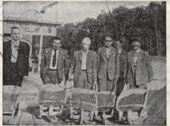
Zarząd Okręgu na Sowińcu.