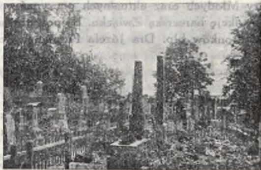
Groby wojenne w trakcie uporządkowania.