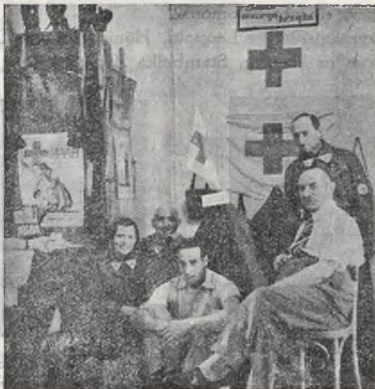
Wystawa Hygieniczna Koła P. C. K. przy Z. Ż. U. W. o N. P.

Koło Czerwonego Krzyża przy Związku Żydów Uczestników Walk o Niepodległość rozwinęło w okresie sprawozdawczym żywszą działalność. Przeprowadziło 3 kursy ratownicze, a mianowicie: w szkole 38. (ul. Żółkiewskiego — Grzegórzki) 6 godz. wykł. ok. 120 uczn., w szkole 30. (ul. Pułaskiego — Dębniaki) 6 godz. wykł. ok. 60 uczn. i w I. Bursie Rękodzielniczej (ul. Krakowska). W czasie pogrzebu śp. Marszałka Piłsudskiego wystawiono 6 punktów ratowniczych, wyposażonych w lekarzy, pielęgniarki i sanitariuszy. W czasie wyświetlania filmów z pogrzebu śp. Marszałka Piłsudskiego w kinach krakowskich, wystawiono 3 patrole sanitarne. Następnie wyposażono w apteczki P.C.K. szkołę przy ul. Sarego i Wąskiej. Podobnie wyposażono w apteczki Kolonję dla najbardziej potrzebującej dziatwy w Jordanowie i Kolonję harcerską w Zawoju (ostatnia — dar Oddziału P.C.K.).