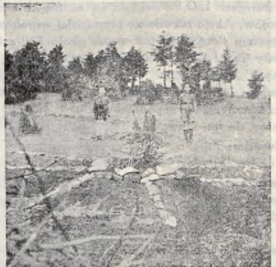
Ułożenie krzyża legionowego i ogniska w dn. 6. VIII. br.

Przy II-gim turnusie urządziły się 2 kursy instruktorskie, a to jeden dla wodzów zachowowych, II-gi zaś dla zastępowych. Przez utworzenie kursów zastępowych, nasz Komitet Organizacyjny wyszedł z początkowego stadium organizowania ruchu zachowowego, przechodząc w dalszy etap pracy, t.j. zorganizowanie zastępów harcerskich.