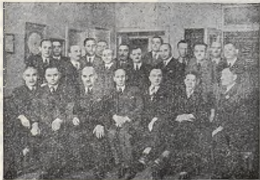
Zarząd Oddziału krak. Z. Ż. U. W., o N. P.