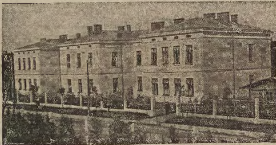
OGÓLNY WIDOK SZKOŁY POLICYJNEJ W MOSTACH WIELKICH.

3 baony szkolne, liczące po trzy kompanie o składzie liczebnym 60-70 szeregowych, uczą się szeregowi i podoficerowie policji, którzy po ukończeniu specjalnego kursu, trwającego sześć miesięcy, zdają egzamina przed specjalną komisją, delegowaną z Warszawy, a dopiero po dodatnich wynikach mają prawo do dalszych awansów.