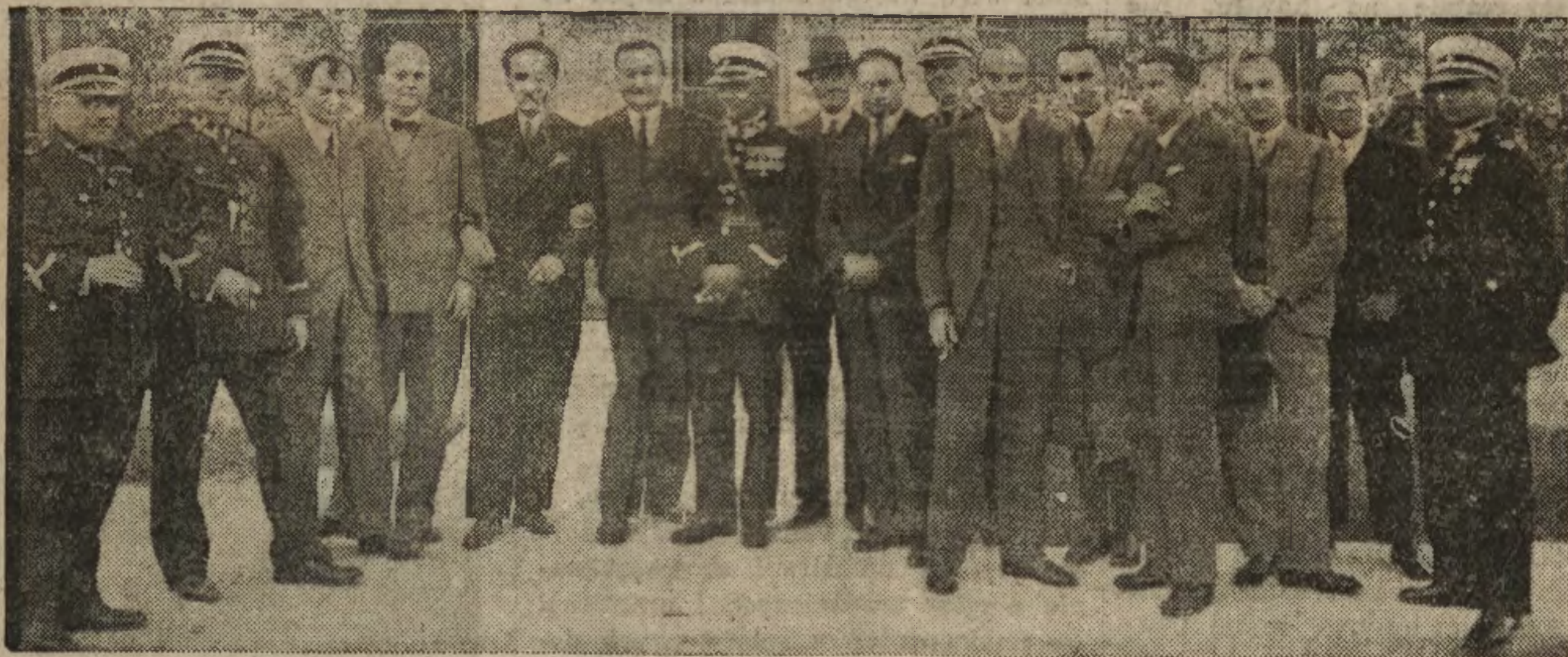
W SZKOLE POLICYJNEJ W MOSTACH WIELKICH.

Bryndzę małą, wedliny delikatesowe, krakowskie i mazurskie poleca firma „ZAKOPANE” Akademicka 24.