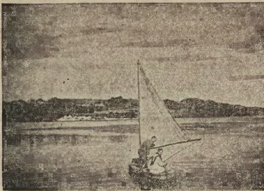
FRAGMENT MALOWNICZEJ OKOLICY PONIKWY.