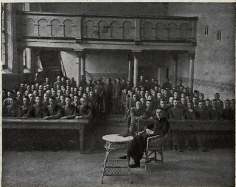
Nauka religii w b. Wojskowym Więzieniu Karnym w Stanisławowie (r. 1927).

Za bardzo ważną czynność uważałem chodzenie po oddziałach i szpitalu więziennym i zetknięcie się osobiste z więźniem. Poufna rozmowa, często spełnienie jego życzenia, po porozumie-