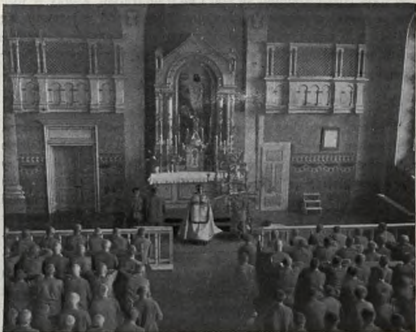
Nabożeństwo w kaplicy w b. Wojskowym Więzieniu Karnym w Stanisławowie. (Przed odnowieniem kaplicy).

pogadanki, mówiłem o zasadach moralnych, wplatając jak najwięcej przykładów wziętych z życia, w II-giej części prowadziłem pogadankę na temat: „Co się dzieje na świecie“, wspominając o najważniejszych wydarzeniach w Polsce i zagranicą. Pogadanka taka wywierała na więźniów wielki wpływ i wzbudzała ich zainteresowanie, bo kiedy w jakimś dniu taką pogadankę