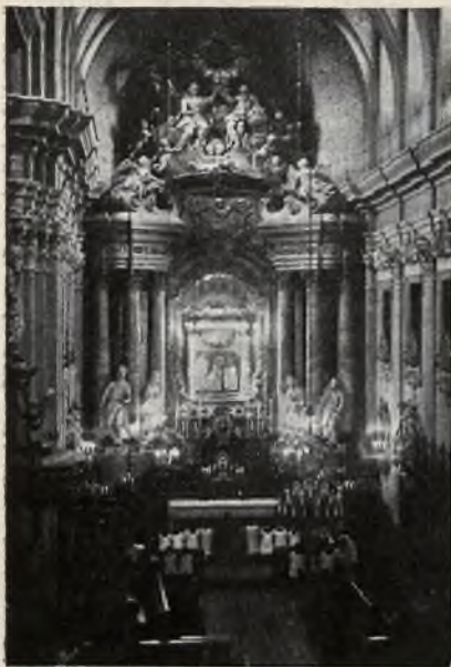
Kościół o. o. Jezuitów w Starej Wsi.

wojsko. Na triumfalnej bramie widniał napis: „Serdecznie witamy 2 P. S. P.“