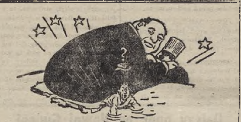
Mocno się poci Anglik przytłoczony ciężarem przyjaźni żydowskiej...

Cranborne oświadczył, że sprawa żydowskiej armii stanowi przedmiot rozważań. O tej armii wogóle dużo debatowano. Davies opowiadał o „ofertach” żydów, które potraktowano niezwykle poważnie. Takie „przysięgi”, które nam oddali żydzi na wszystkich frontach Środkowego Wschodu, nie zostały oficjalnie docenione”. Ale nie w tym dziwnego.