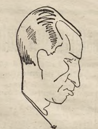
SKEMA (Wilno) - uplasował się na 4 miejscu, - 7 pkt.