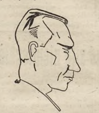
WAJTONIS (Wilno) - zwycięzca I Szachowego Turnieju Międzynar. w Wilnie.

Pierwszy w Wilnie międzynarodowy turniej szachowy zakończył się sukcesem wilnian. Pierwsze miejsce przypadło Wajtonisowi - 8,5 pkt. (44,5) przed Łotyszem Bergiem - 8,5 pkt. (40,5), trzecie miejsce zdobył Törn (Estonia) - 7 pkt. (36) przed drugim wilnianinem Skemą - 7 pkt. (33,25).