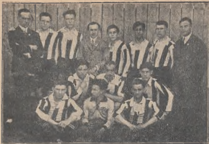
Z. T. S. »JUTRZENKA«, KRAKÓW.

stosowana jedynie gimnastyka i ten wyłącznie system w połączeniu z zabawami ruchowymi ma być stosowany aż do 15 roku życia. Po takim przygotowaniu wstępnym może być chłopak oddany sportowi. Nabytą w ten sposób na kursach gimnastycznych sprawność mięśni, najlepiej zużytkuje młodzieniec na boisku sportowym. Dowiedziona jest rzeczą, że najlepszymi sportowcami są gimnastycy. Ale sportowcem może być młodzieniec 15 lat, rzadko pozostaje on we formie dłużej. Z 35-tym rokiem życia zwykle kończy się jego karjera sportowa. Czyżby musiał mężczyzna w sile wieku rezygnować z ćwiczeń fizycznych? Wcale nie, jeśli uprawiał gimnastykę. Skoro zabrakło lekkości sportowcowi, to przecież tkwi w nim tężyzna gimnastyka. Czego nabył jako młodzieniec na