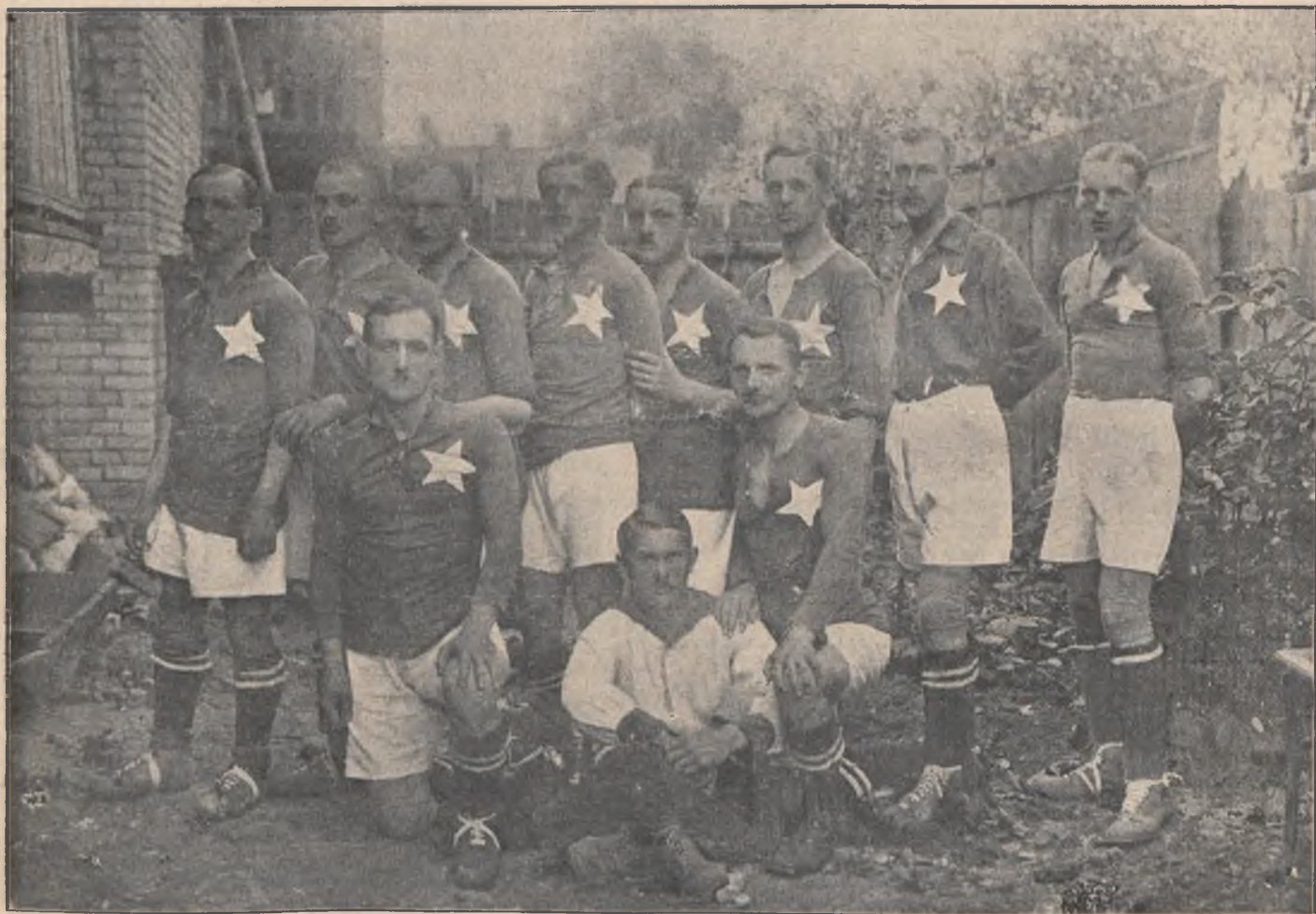
T. S. »WISŁA« — KRAKÓW.

WE CZWARTEK DNIA 23 CZERWCA 1921 O GODZ. 6 \frac{1}{2} , POPOŁ. NA PLACU MAKKABI MATCH FOOTBALLOWY