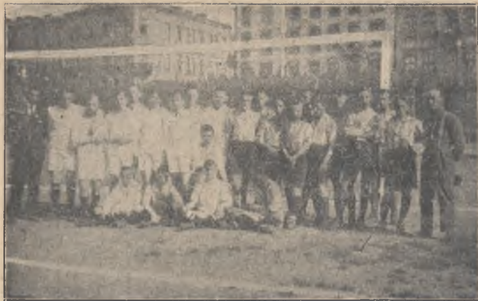
JUNIORZY »MAKKABI« i »CRACOVII«

IV. Ćwiczenia lekko-atletyczne, odpowiedniejsze dla uczniów klas najstarszych.