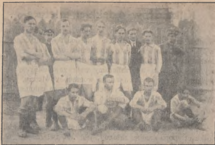
DRUŻYNA »CRACOVIA« II.

stosowana jedynie gimnastyka i ten wyłącznie system w połączeniu z zabawami ruchowymi ma być stosowany aż do 15 roku życia. Po takim przygotowaniu wstępnym może być chłopak oddany sportowi. Nabytą w ten sposób na kursach gimnastycznych sprawność mięśni, najlepiej zużytkuje młodzieniec na boisku sportowym. Dowiedziona jest rzeczą, że najlepszymi sportowcami są gimnastycy. Ale sportowcem może być młodzieniec 15 lat, rzadko pozostaje on we formie dłużej. Z 35-tym rokiem życia zwykle kończy się jego karjera sportowa. Czyżby musiał mężczyzna w sile wieku rezygnować z ćwiczeń fizycznych? Wcale nie, jeśli uprawiał gimnastykę. Skoro zabrakło lekkości sportowcowi, to przecież tkwi w nim tężyzna gimnastyka. Czego nabył jako młodzieniec na