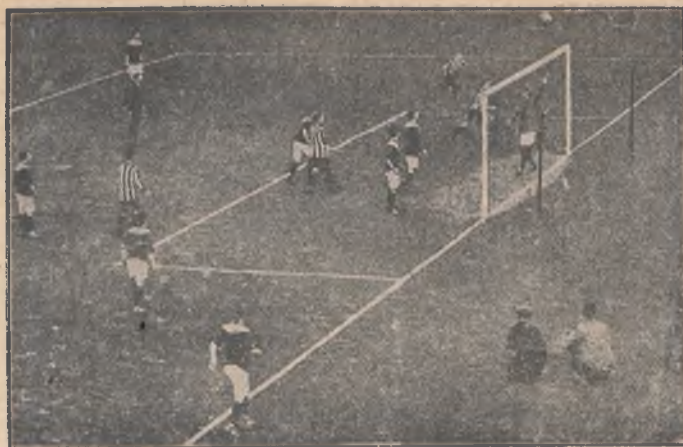
Z walk o puchar Crystal-Palace, korzystny moment dla Newcastle United.

Monachium: Wacker Monachium — Zach. Szwajc. Mistrz. Servette 3:2.