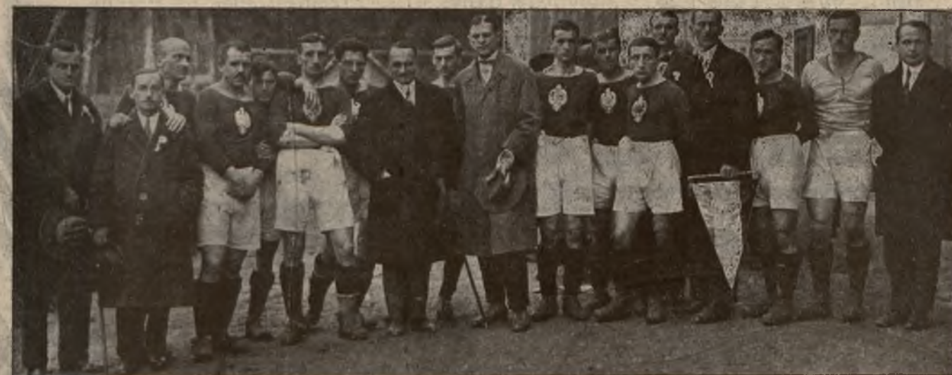
Team Polski przeciw Jugosławii dnia 1 października 1922 r. w Zagrzebiu.

Glasgow Rangers zdobył w bieżącym roku mistrzostwo ligi szkockiej, puhar szkocki i puhar Glasgowa. Hagler , były gracz Rapidu, a następnie trener Florisdorfu, Wackeru, a ostatnio Neubau, został zaangażowany do FC. Bern w Bernie szwajcarskiem.