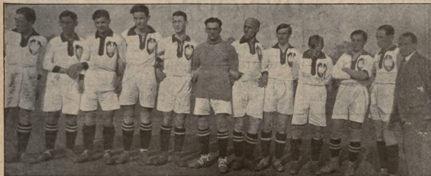
Team Polski przeciw Węgrom dnia 14 maja 1922 r. w Krakowie.

szczególnych walkach zostali: Międzynarodowy mistrz: Szkocja, puhar Fify: Bolton Wanderers, puhar amatorski: London Caledonians, puhar szkocki: Glasgow Rangers, I liga: Liverpool, II liga: Notts County, III liga połudn.: Bristol City, III liga półn.: Nelson, szkocka liga: Glasgow Rangers, puhar Londynu: Charlton Athletic, puhar Glasgowa: Glasgow Rangers. Z I ligi do II. schodzą: Stoke, po jednorocznym pobycie w I lidze i Oldham Athletic. Do I ligi wchodzi Notts County i Westham United. Do II ligi wchodzi: Bristol City i Nelson, a z II do III ligi schodzą Rotterdam County i Wolverhampton W. WAC., FAC., Rudolfshügel są kandydatami do zejścia do II klasy we Wiedniu.