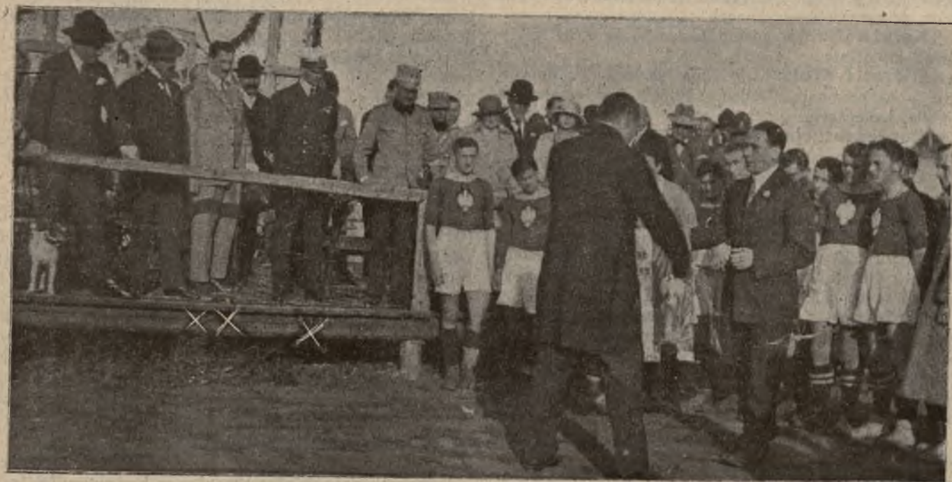
Team Polski przeciw Rumunii dnia 3 września 1922 r. w Czerniowcach.