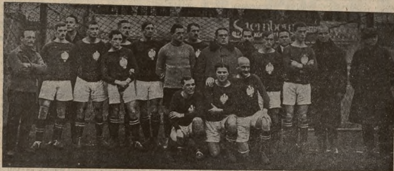
Team Polski przeciw Węgrom dnia 18 grudnia 1921 r. w Budapeszcie.