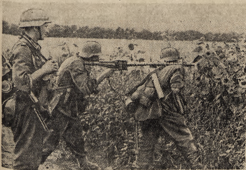
Fragment walk w otwartym polu.

Część prasy międzynarodowej, nie opanowana przez żydów, potępia zgodnie napaść sowiecko - brytyjską na Iran, uważając ten akt przemocy za interesującą ilustrację niezdefiniowanych rozmów atlantyckich Churchilla z Rooseveltem. Zrobiło to wszędzie jak najgorsze wrażenie, że Anglia wspólnie z Rosją napada na słabe państwa, ponosząc jednocześnie w walce z Niemcami jedną klęskę po drugiej. Churchill posłał do Iranu gen. Wavella, który podczas walk z wojskami niemieckimi i włoskimi w Afryce zawiódł w zupełności. „Napoleonowi pustyni” dano więc okazję do naprawienia sławy poważnie nadszarpniętej po walkach w Cyrenaice.